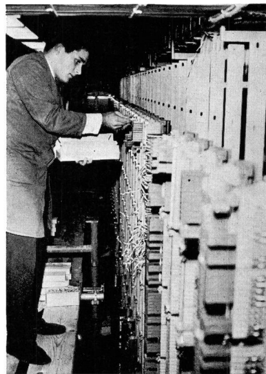
Fig. 2 Mise en service des raccordements d'abonné au nouveau répartiteur principal

Après un souper pris en commun, les participants furent invités à visiter l'ancien central où ils purent assister à l'établissement manuel des dernières communications par les téléphonistes des services spéciaux. Ils furent ensuite conduits dans le nouveau bâtiment pour être présents lors de la commutation proprement dite et des travaux nécessaires tels que coupure des jonctions entre répartiteurs, mise en service des raccordements d'abonnés sur les nouvelles bases, etc. Une visite des