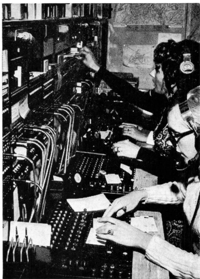
Fig. 1 Etablissement des dernières communications téléphoniques au central manuel des services spéciaux