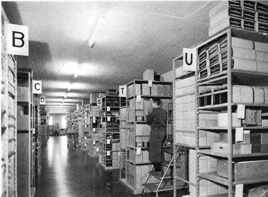
Blick in das Zentralmagazin. Apparate werden auf Regalen gelagert Vue du magasin central. Les appareils sont déposés sur des étagères View of the central depot. Equipment is stored on shelves

lange Sicht wirtschaftliche Lösungen zu suchen. Die hohen Grundstückskosten wirken sich besonders für das Aufbewahren des Linien- und Kabelmaterials nachteilig aus, weil dafür eine grosse Lagerfläche benötigt wird. Eine Konzentration auf wenige Linienmaterialmagazine und Schwermateriallager ausserhalb der Städte drängt sich daher auf. Durch das Erstellen von Regionallagern kann erwartet werden, dass der gesamte Bau-Finanzbedarf reduziert und die jährlichen Betriebskosten gesenkt werden.