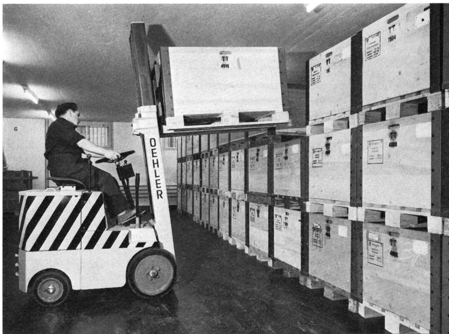
Gabelstapler erleichtern dem Magazinpersonal die Handhabung der Boxpaletten Des élévateurs à fourche facilitent la manutention des palettes Fork lifts facilitate the handling of pallets

Infolge der hohen Bodenpreise und der Verteuerung des Bauens sind die Lagerhaltungskosten in den letzten Jahren stark angestiegen. Dies zwingt uns, neue, auf