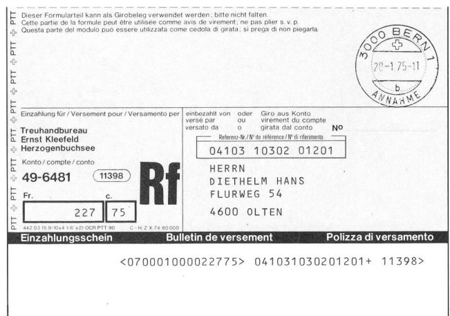
Fig. 2 Verarbeitungsbeleg personalisiert und mit Daten versehen – Document de traitement individualisé et revêtu de données

Les propriétés de l'encre d'imprimerie correspondent en partie à celles de l'encre servant à l'impression des chèques. Toutes les indications concernant l'adhérent doivent être imprimées en noir. La désignation abrégée de l'imprimerie, dans la norme de référence, facilite une éventuelle identifi-