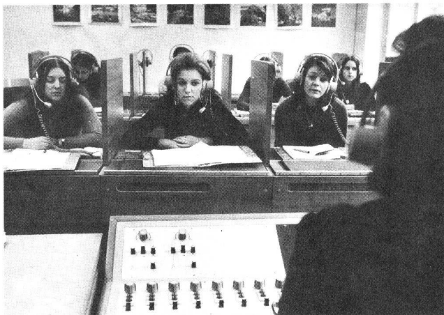
Sprachlabor – Laboratoire de langues

Eine Umfrage bei den Kreistelefondirektionen ergab, dass die Sprachlabors mit gutem Erfolg für den Fremdsprachenunterricht eingesetzt werden. Telefonistinnen und Telegrafistinnen sind in kürzerer Zeit in der Lage, ihre Fremdsprachenkenntnisse anzuwenden. Mit dem Sprachlabor wird besonders der mündliche Ausdruck stark gefördert.