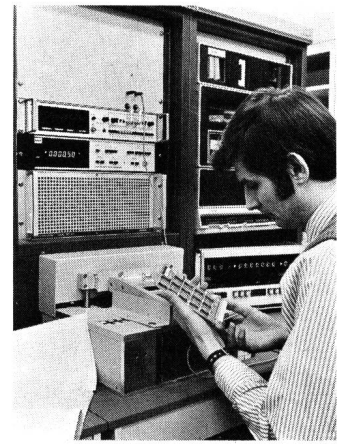
Fig. 5 Pegamat, universelles Prüfsystem für elektronische Leiterplatten und Geräte

Abschliessend fand noch die Vorführung des universellen Prüfsystems für die Elektronik, Pegamat, statt. Dieses dient für Analog- und Logikprüfungen von Leiterplatten und ganzen Geräten. Der modular aufgebaute Prüfautomat eignet sich auch für die Prüfung hybrider Schaltungstechniken. Für das Anschalten analoger Objekte steht ein Schaltfeld mit maximal 320 zur Prüfung digitaler Schaltungen mit maximal 360 Anschlusspunkten zur Verfügung. Als Prüfsprache wird eine adaptierte Version von Standard-ATLAS verwendet. Figur 5 zeigt den Pegamat-Prüf- und Messautomaten, der bei verschiedenen Produktionsbetrieben von Siemens im Einsatz steht.