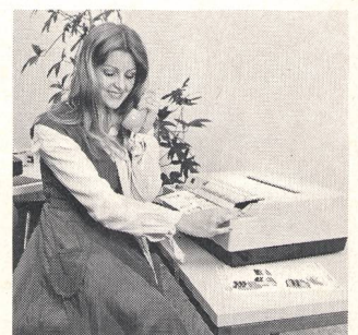
⑧ Fernkopieren Appareils de communication

Senden Sie mir detaillierte Unterlagen ① ② ③ ④ ⑤ Faites-moi parvenir une documentation détaillée ⑥ ⑦ ⑧ ⑨ ⑩