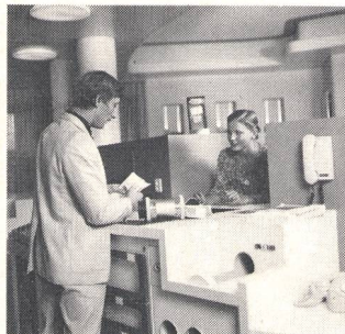
② Fördertechnik Convoyeurs pour documents et objets divers