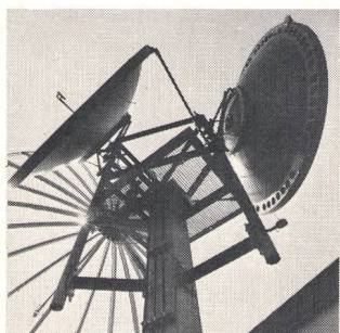
⑥ Antennentechnik Antennes