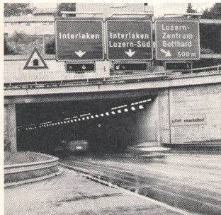
① Strassenverkehrstechnik Technique de commande du trafic routier par feux lumineux

Ich interessiere mich für folgende Teilgebiete: (Zutreffendes ankreuzen)