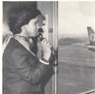
③ Tontechnik Sonorisation