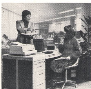
⑩ Datenverarbeitung Informatique