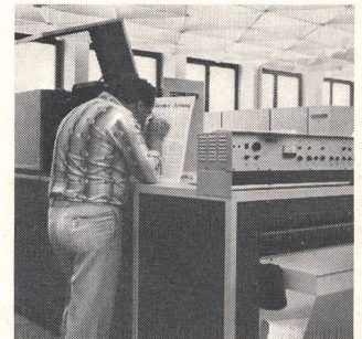
④ Digiset Lichtsatzanlagen Photo composeuses Digiset