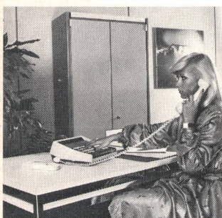
⑨ Haustelefonzentralen Centraux téléphoniques privés