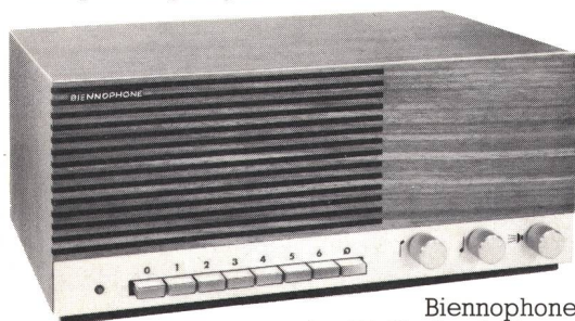
Biennophone das TR-Gerät mit Klasse