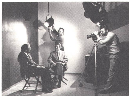
Fig. 1 Die richtige Ausleuchtung einer Szene ist wesentlich für eine gelungene Videoaufnahme

Die Ausbildung geht an verschiedenen Arbeitsplätzen vor sich, wo in kleinen Gruppen gearbeitet wird. Nach jedem erreichten Arbeitsziel findet ein Arbeits-