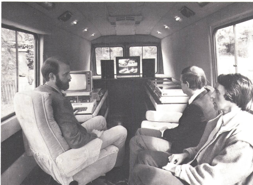
Fig. 1 In diesem fahrbaren Vorführraum wird bis zu fünf Personen Gelegenheit zu einer computergesteuerten Bildplattenvorführung an ihrem eigenen Standort geboten. Das Infomobil verfügt über eine eigene Stromanlage und ist mit einer Multi-Player-Ausrüstung ausgestattet.

– Automobilhersteller für die innerbetriebliche Schulung sowie für Reparaturinstruktion