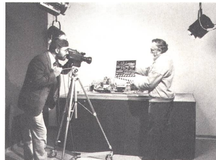
Fig. 2 Das Drehen eines Videofilms während des Seminars ist nicht nur eine technische, sondern auch eine gestalterische Aufgabe

platzwechsel statt, so dass jeder Teilnehmer alle verfügbaren Geräte kennenlernen kann. Auf die Ausstattung der Arbeitsplätze wurde sehr grosser Wert gelegt. Die eingesetzten Geräte sind zwar weitgehend jene, die die Firma Saba in ihrem vollständigen Videoprogramm anbietet, doch finden sich auch solche anderer Hersteller darunter, damit der Kursbesucher möglichst vielseitige Erfahrung erlangt.