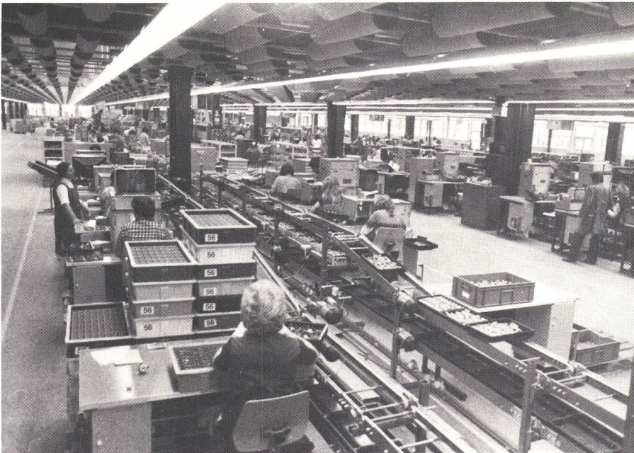
Fig. 3 Blick in einen Teil der Fertigungshalle für das neue Fernsehempfänger-Chassis

Am Schluss jedes Kurses findet ein das gesamte Arbeitsgebiet betreffender Test statt. Die erfolgreiche Teilnahme am Seminar der Video-Schule wird durch ein Diplom bekundet. Die Kosten betragen zwischen rund 250 DM für den Zweitageskurs und knapp 400 DM für das viertägige Seminar. Seit Bestehen der Schule — Juli 1981 — war sie fast immer voll ausgebucht, auch von Amateuren, die sich hier Fachwissen aus «erster Hand» holten.