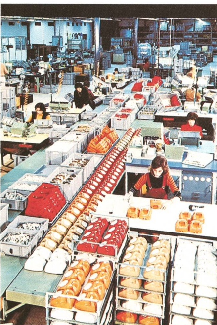
Montage von Telefonapparaten Montage d'appareils téléphoniques Telephone set assembly

Durch solche Erwägungen gefördert, haben sich zum Beispiel die drei schweizerischen Telefonstationenlieferanten zu einer Arbeitsgemeinschaft Telefonstation 1985 (ATS 85) zusammengeschlossen und eine moderne Teilnehmerstationsfamilie ent-