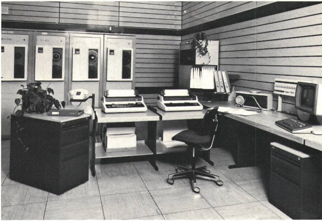
Fig. 2 Bedienungsraum der Telexzentrale Basel – Local de desserte du central télex de Bâle

den Energieverbrauch auf etwa einen Viertel des bisherigen Umfangs zu verringern.