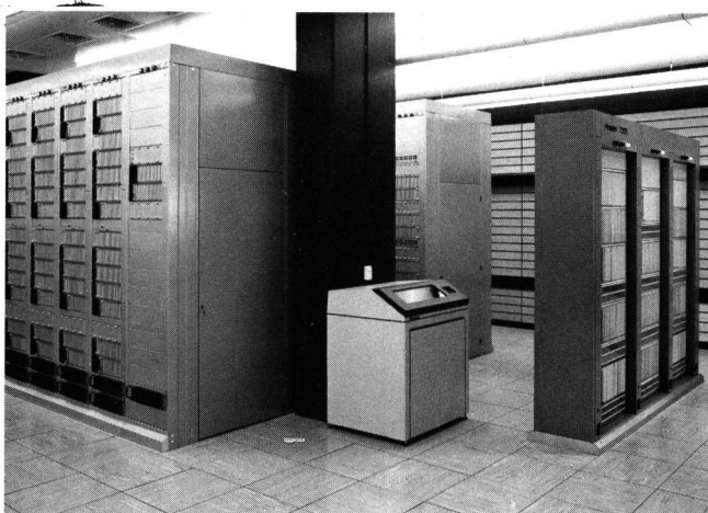
Fig. 1 Telexzentrale Basel. Gestelle für die Leitungsausrüstung und das Zentralsystem (rechts) – Central télex de Bâle. Bâties des équipements de lignes et de l'unité centrale (à droite)

Le système T203 se fonde sur les principes de base de la génération T202, qui ont été adaptés aux plus récentes connaissances. Les unités triplées du processeur de central fonctionnent en parallèle et sont pourvues d'un ensemble commun de service et de diagnostic (moniteur). La mémoire centrale est doublée et contient à la fois des programmes et des données, de manière que