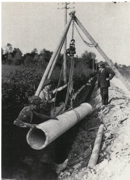
Fig. 2 Bau der Rohrleitung Genf–St. Gallen, 1921–1924 als Arbeitsbeschaffung erstellt. In ihr konnte zwischen St. Gallen und Wil das Glasfaserkabel eingezogen werden, ohne Strassen aufreißen zu müssen

Zürcher Niederlassung der japanischen Firma Itoh geliefert. Einzug, Spleissung und Kontrollmessungen erfolgten durch