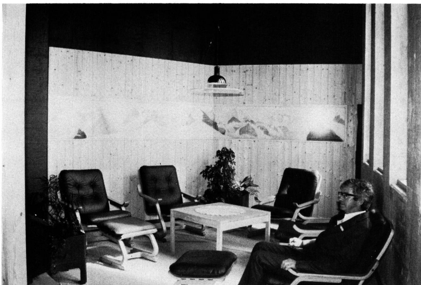
Was wichtig ist: Das Betriebspersonal verfügt — für längere Arbeiten in der Anlage — über geeignete Unterkunfts-möglichkeiten. Hier der Aufenthaltsraum

Berg ins Tal verlegt werden. Dann folgten 12 Nachzüge, bis der erforderliche Seildurchmesser von 42 mm erreicht war. Für die Flugsicherheit stellte auch die Signalisierung der Kabel während der Nacht Probleme. Nach zwei gescheiterten Versuchen mit Windgenerator und Dynamo wurde ein auf die Transportseilhöhe abgesenkter Stromkabel mit Drehleuchten eingesetzt.