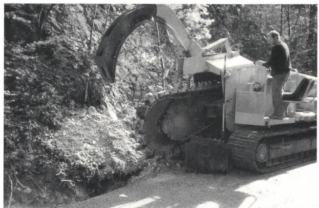
Fig. 4 Einsatz einer Kettenfräse T-650 im Jurafels (Kettenrad \varnothing = 1,00 m mit hochgestelltem Sohlenräumer) – Emploi d'une trancheuse à chaînes dans la roche du Jura (roue à chaîne d'un \varnothing de 1 m avec dispositif de déblayage relevé)

Le prix indicatif du mètre courant de fouille excavée dans une route avec 10 cm de revêtement, sans remblayage et compactage, est à peu près égal à 2 fois la