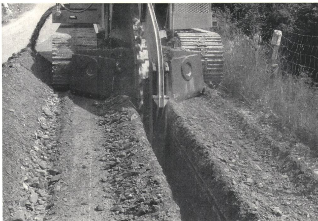
Fig. 1 Kettenfräse T-650 mit Ausleger und drehbaren Rundschaftmeisseln eignet sich für Grabarbeiten in Strassen, Felspartien und Ackerland. Grabenbreiten 30 bis 60 cm, Grabentiefen 1,00 bis 1,80 m. Tagesleistungen in Strassen bis etwa 600 m (grössere Kettenfräsen erreichen Grabentiefen von 2,50 und 4,50 m) – La trancheuse à chaînes T-650 avec bras et couteaux rotatifs convient pour l'excavation de routes, de terrains rocheux et de terrains cultivables. Elle réalise des fouilles d'une largeur de 30 cm à 60 cm et d'une profondeur de 1,00 m à 1,80 m sur une longueur de 600 m par jour (les grandes fraises à chaînes creusent des fouilles de 2,50 m à 4,50 m de profondeur)

festen Böden und Belagsdicken bis 30 cm und mehr eignen sich sehr gut für Fräseinsatz (Fig. 1 und 2)