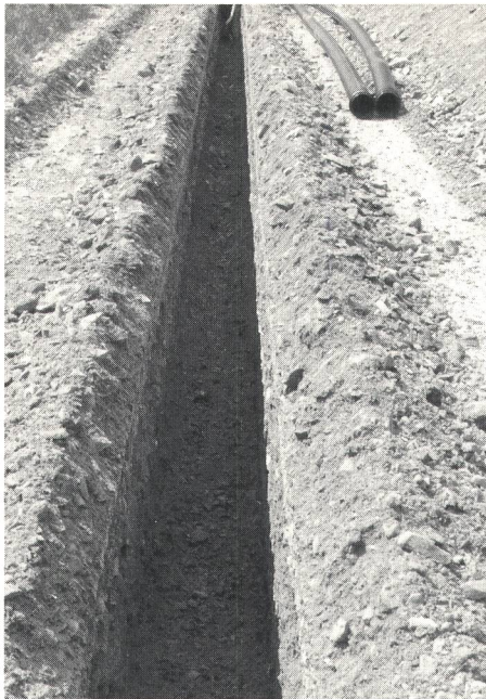
Fig. 3 Gefräster Graben für die Erstellung eines Rohrblocks der Fernmeldekreisdirektion Sitten – Fouille ouverte à la trancheuse pour l'établissement d'un bloc de tuyaux à la direction d'arrondissement des télécommunications de Sion