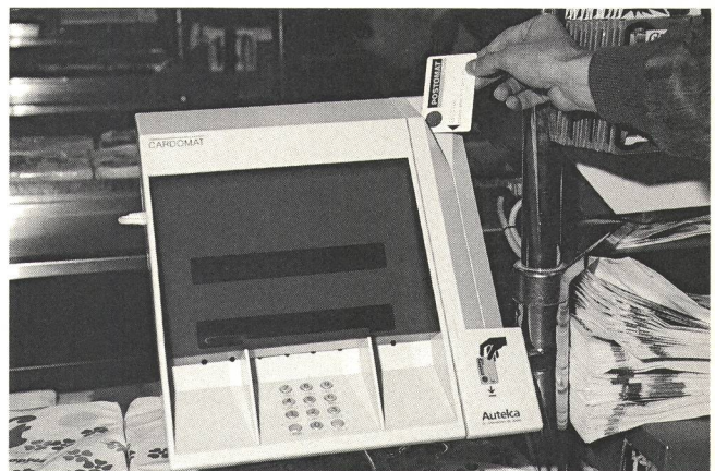
Fig. 2 Postomat-Plus-Karte wird am Cardomat-Terminal im Einkaufszentrum Shoppyländ in Schönbühl eingelesen - Carte Postomat Plus lue par un terminal Cardomat au centre d'achats du Shoppyländ à Schönbühl

Depuis la fin du mois de février 1988, les PTT participent au moyen de leur carte Postomat Plus à l'essai de la Migros EFT-POS Cardomat de Shoppyländ à Schönbühl près de Berne. La carte à mémoire utilisée est celle de Bull, France. Le système a été développé sous licence en Suisse par Autelca à Gümligen. Grâce à cette carte, il est possible de procéder à des achats, de retirer de l'argent comptant jusqu'à concurrence de 300 francs à la caisse du magasin et de prélever jusqu'à 500 francs au distributeur de billets Postomat. La limite du montant disponible chaque mois mémorisé dans le microprocesseur est de 3000 francs. Il est possible de mémoriser jusqu'à 180 transactions sur cette carte. La transmission des données au centre de calcul du service des chèques postaux se fait en direct par le biais du réseau Télépac, étant entendu que les comptes de chèques postaux correspondants sont débités chaque jour. Le système Cardomat est un système ouvert, grâce auquel on peut utiliser aussi bien la carte M à piste magnétique de la Migros que la carte Postomat Plus à mémoire des PTT (fig. 2). Grâce à cette politique, une exigence essentielle