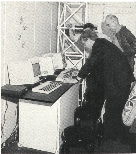
Les futurs usagers s'initient au «Télégiro»

l'Entreprise des PTT met tout en œuvre et consent à de gros investissements pour créer les moyens de communication de l'avenir, dont l'économie nationale a besoin pour s'épanouir.