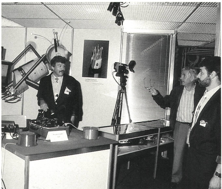
De nombreuses démonstrations permettaient au public de mieux se rendre compte de la spécificité de certains travaux

Invitée d'honneur au Comptoir suisse de 1988, l'Entreprise des PTT a saisi l'occasion de faire connaître ses prestations sous un jour nouveau. Elle a montré, et les réactions du public l'ont prouvé, qu'elle était en mesure de faire face aux multiples problèmes que lui réserve l'avenir. Par les colloques du symposium tenu en parallèle, elle a aussi provoqué la réflexion et démontré aux milieux intéressés qu'elle était consciente de la tâche qui lui est dévolue.