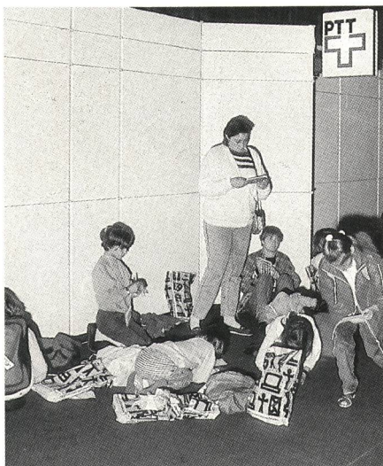
L'intérêt pour les concours ou les questionnaires était aussi grand pour les plus jeunes...

Tel était le thème choisi pour offrir aux visiteurs une vue d'ensemble des presta-