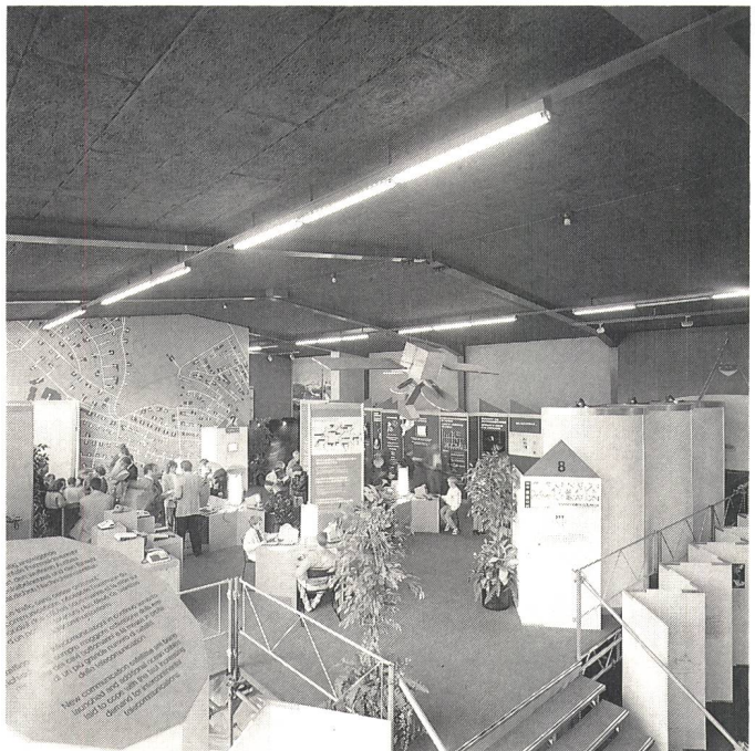
KOMM 89: der PTT-Stand

Seit Jahrhunderten betrachtete es der Mensch als ein Gebot, das erworbene Gedankengut zu bewahren und an kommende Generationen weiterzugeben. So findet das Wort «Museum» seinen Ursprung in der Ende des vierten Jahrhunderts v. Chr. in Alexandria errichteten grossen Bibliothek, die als Stätte der Museen (Göttinnen der Künste und der Gelehrsamkeit) betrachtet wurde. Heute noch gehört das Sammeln und Aufbe-