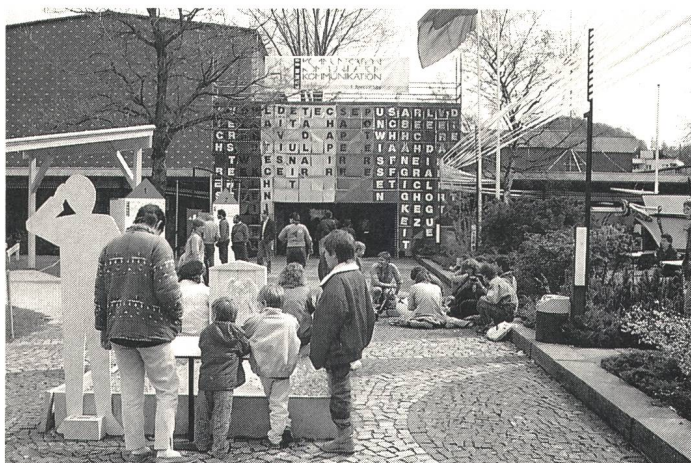
. . . und zwei Stunden später sind alle Texte an der grossen Tafel am Eingang der Ausstellung lesbar

In der Fernmeldehalle wird die eigene Amateurfunkstation Verkehrshaus von Mitgliedern der Union Schweizerischer Kurzwellen-Amateure betrieben. Auch informiert der einzige Schweizer Glasfaserfabrikant über die Herstellung von Glasfaserkabeln . Die wichtigsten Schritte in der Entwicklungsgeschichte der Kommunika-