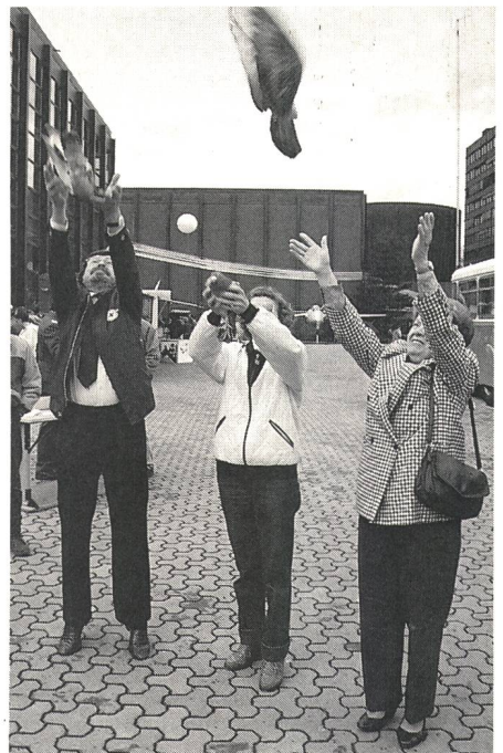
Auch bei diesem «Kommunikationssystem», der Brieftaube, wird das Publikum zum Mitmachen angeregt

Eine Sonderveranstaltung wie KOMM 89 wäre undenkbar ohne die Mitarbeit vieler Partner, um so mehr als die Ausstellung Beispiele aus dem täglichen Leben veranschaulicht. Dies bedeutet nicht nur das Zur-Verfügung-Stellen technischer Ein-