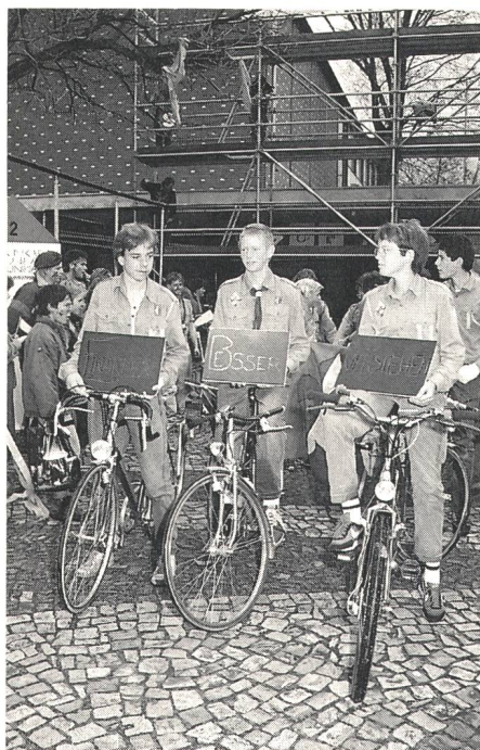
Die erste Meldung von «Echo Schweiz» trifft ein . . .

sten Juli 1959 fand die Eröffnung des Museums statt, zu dem von Anfang an die PTT-Ausstellungshallen gehörten. Zehn Jahre später konnten ein Planetarium, ein Restaurant und ein Bürogebäude errichtet werden. 1972 kam eine Halle für Luft- und Raumfahrt dazu. In einer weiteren Ausbautetappe wurde das Museum mit dem Hans-Erni-Haus (1979), einer zusätzlichen Eisenbahnhalle (1982) und einer Halle Schifffahrt, Seilbahnen und Tourismus mit dem Rundfilmtheater Swisso-rama (1984) erweitert.