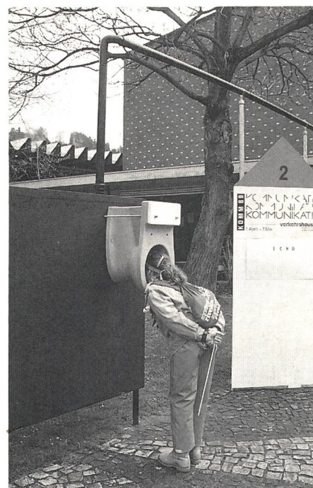
Dies ist ein originelles Kommunikationsmittel, das jedoch technisch den neuesten Forderungen noch nicht entspricht

Mit der Kommunikation im Spiel werden die jugendlichen Besucher zu Urformen der Kommunikation zurückgeführt. Kinder spielen mit Geräten, bei denen die Kommunikation zur Bedingung wird, wie Sprechrohren, Balancierbalken, federnden Bohlen oder Partnerschaukeln. Denkanstösse zur Kommunikation bilden Objektgruppen, die auf die Kommunika-