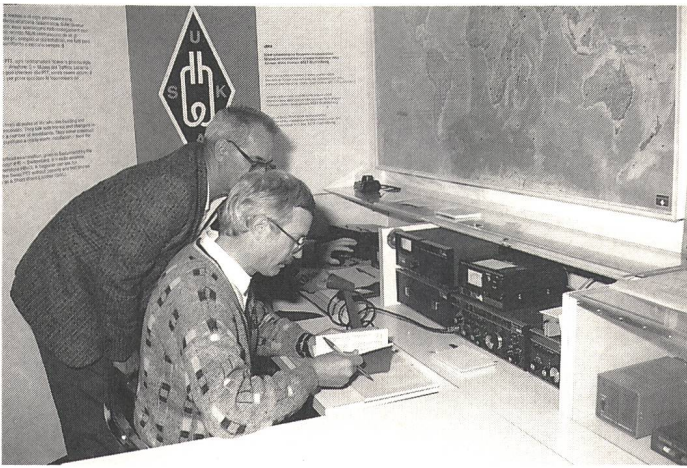
Sende- / Empfangsstation «Verkehrshaus» der Schweiz. Union der Kurzwellen-Amateure (USKA)