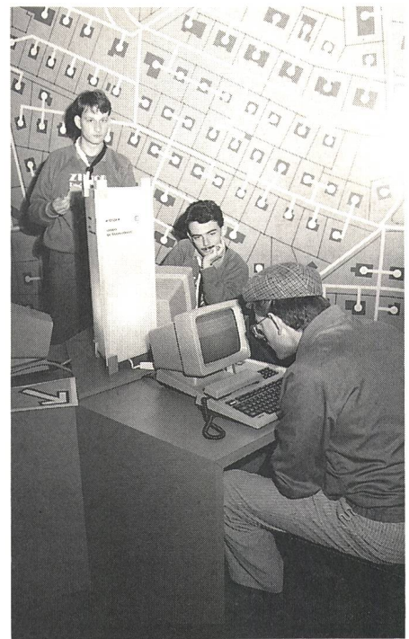
Erste Versuche mit dem Lexikon der Kommunikation

tion können anhand zahlreicher Original-exponate nachvollzogen werden. Das Modell einer Hochwacht zeigt, wie mit Feuer und Rauchzeichen das Land alarmiert wurde. Der Morseapparat, der erste Telefonapparat von Johann Philipp Reis sowie die Erfindung der Telegrafie sind wichtige Etappen in der Geschichte der Kommunikation. Stellvertretend für die Erfindung des Rundfunks ist der Sender Marconi als zweiter Radiosender von Lausanne ausgestellt.