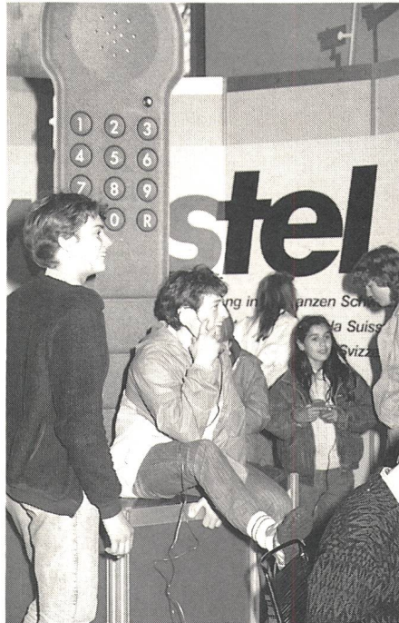
Das Gratistelefon am Stand der PTT wird reger benützt

Die PTT-Betriebe erläutern den Grossversuch Kommunikationsmodellgemeinde . In zwölf Gemeinden gelangen neueste Kommunikationstechnologien zur Anwendung, um daraus Erfahrungen für die Zukunft zu sammeln. Die Kundendienste sind ebenfalls gut vertreten. PTT-Personal zeigt die neuesten Telefonapparate und Videotextgeräte für den privaten Haushalt. Besucher können die Apparate ausprobieren und werden durch Fachleute beraten. Über ein Gratistelefon können sie sich mit Verwandten und Freunden in Verbindung setzen.