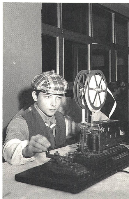
Vielbeachtete Vorführung einer historischen Übertragungseinrichtung