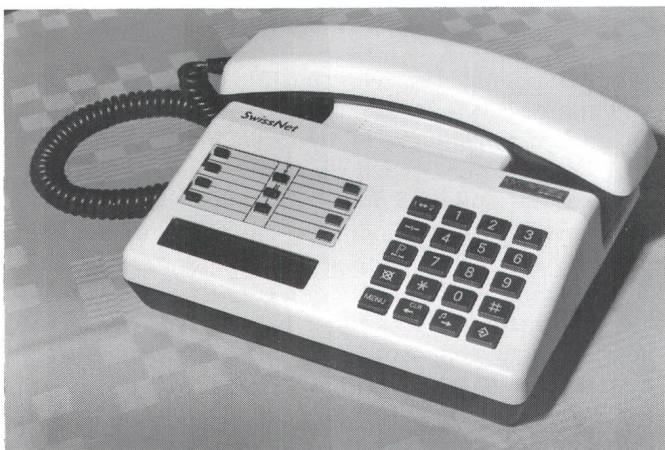
Fig. 2 Tritel Bienne