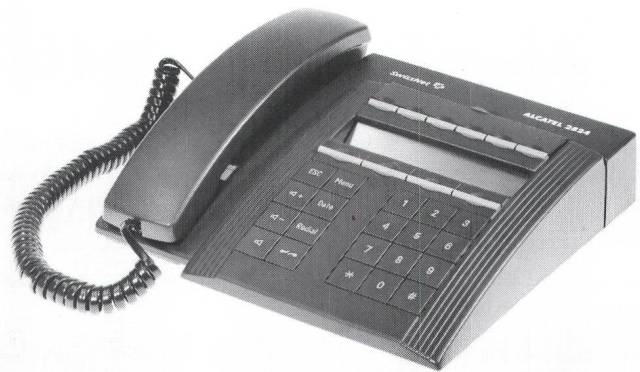
Fig. 3 Alcatel 2824