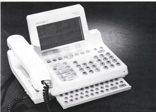
Fig. 1 Crystal , das ISDN-Komfort-Endgerät — Crystal , le terminal RNIS Confort

Das komfortable und leistungsfähige ISDN-Endgerät Crystal (Fig. 1) ist wahlweise mit (als Crystal TA ) oder ohne eingebauten V.24-Terminaladapter erhältlich. Es kann für sich allein an einem ISDN-Basisanschluss betrieben werden. Dank der grossen Anzeige und der Menüführung ist es sehr benutzerfreundlich zu programmieren und zu bedienen. Mit dem seitlich ansteckbaren