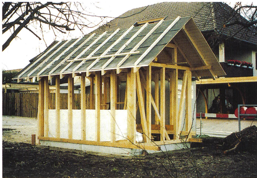
Bild 1. Zur Sicherstellung der Übertragungstechnologie werden an den Baustoff hohe bautechnische Anforderungen gestellt.

Holz gehört heute mengenmässig zu den wichtigsten Rohstoffen der Welt. Seine Bedeutung wird mit dem Wachstum der Erdbevölkerung weiter zunehmen. Zwar wird die Bereitstellung von Holz auf der Basis der derzeitigen produktiven Waldfläche mit der Bevölkerungsentwicklung nicht Schritt halten können, wie alle anderen Ressourcen auch nicht; wo der Wald nachhaltig bewirtschaftet wird, wächst Holz aber nach. Wie kaum ein anderes Material weist Holz grosse ökologische Vorzüge auf. Dazu gehören seine CO 2 -Neutralität, das dezentrale Rohstoffaufkommen zu meist nahe bei den Verarbeitungsstätten, eine gute Wiederverwertbarkeit und eine weitgehend problemlose Entsorgung. Diese Qualitäten lassen die Feststellung zu: Der Massenrohstoff Holz ist nicht zu ersetzen, jedenfalls nicht durch ein ökologisch gleichwertiges Material. Im Gegenteil, aus ressourcenpolitischen und ökologi-