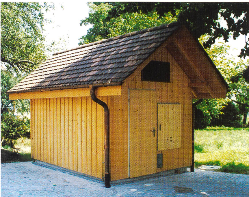
Bild 2. Die neuen Konzentrazentralen müssen sich gestalterisch in das jeweilige Ortsbild möglichst harmonisch einpassen lassen.

Da es sich im Fall einer «Abgesetzten Vermittlungseinheit» um ein eingeschossiges, freistehendes Gebäude handelt, in dem nutzungsbedingt kein erhöhtes Brandrisiko besteht, schreiben die Brandschutznormen und -richtlinien der VKF keine besonderen Anforderungen für diesen Gebäudetyp vor. Die eingebauten technischen Einrichtungen, Apparate und Geräte produzieren zudem eine Abwärme im Temperaturbereich weit unter 80 °C. Der ganze Bau kann somit von Gesetzes wegen ohne weiteres in Holz (Tragwerk und Verkleidungen) erstellt werden. Die internen Baurichtlinien der Telecom PTT verlangen jedoch einen höheren Brandschutzstandard, vorwiegend was den Innenausbau von technischen Räumen mit betriebswichtigen Ausrüstungen betrifft. Für Wand- und Deckenverkleidungen werden in solchen Räumen mindestens schwerbrennbare (Brennbarkeitsgrad 5) oder nichtbrennbare (Brennbarkeitsgrad 6q oder 6) Baustoffe vorgeschrieben. Im weiteren muss, bedingt durch die