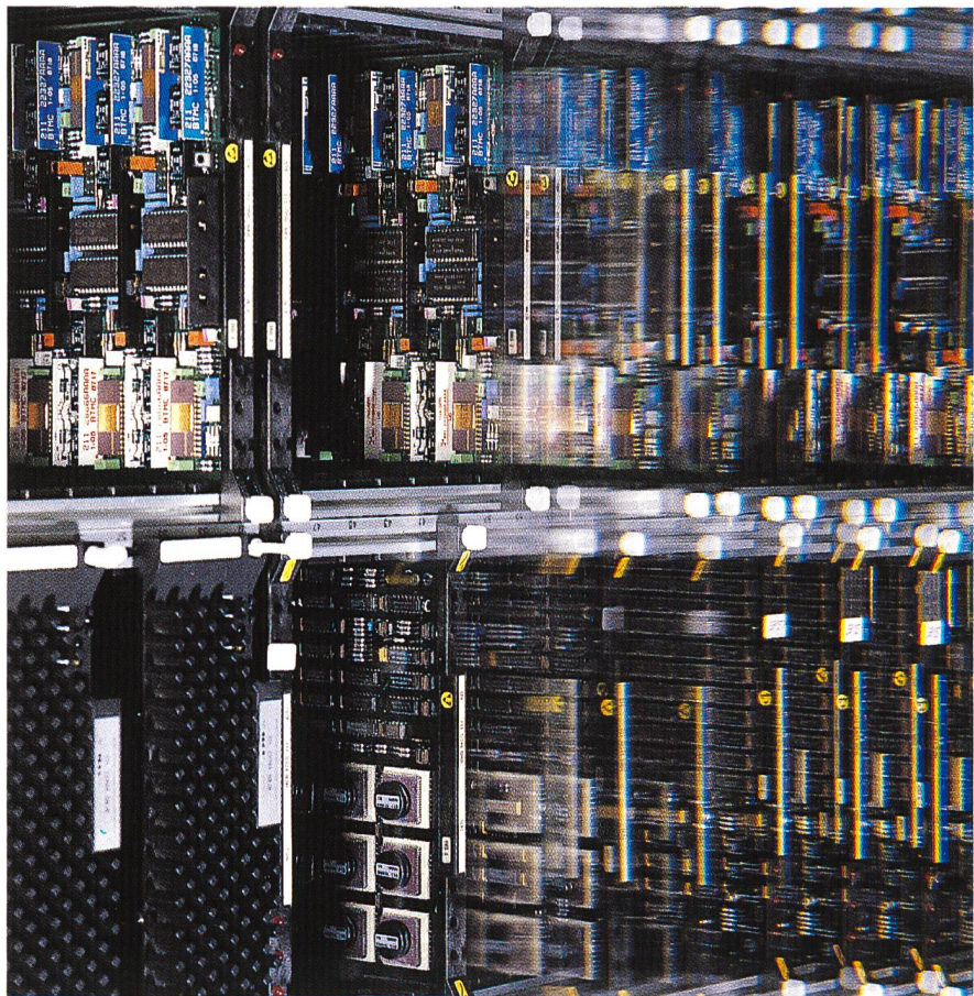
Die Telekommunikationsnetze müssen laufend den technischen Neuerungen angepasst werden.

Will die Telecom PTT gegenüber andern Anbietern ihre heutige gute Position wahren, so muss sie, um diesem gewaltigen Wandel auf der technologischen, politischen und gesellschaftlichen Ebene zu folgen, eine echte Innovationskultur mit Freiräumen zur Entfaltung der Kreativität der Mitarbeiter im Unternehmen fördern. Innovation wird zum eigentlichen Schlüsselement für die Wettbewerbsfähigkeit des Unternehmens.