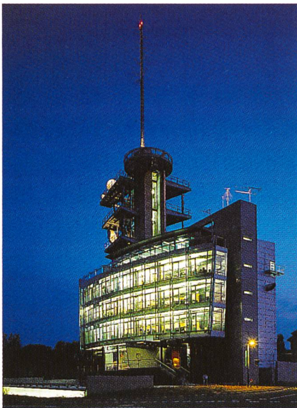
Bild 1. Das Telekommunikationszentrum Odyssea der Telecom PTT in Ecublens als Kommunikationsdrehscheibe in der Westschweiz.