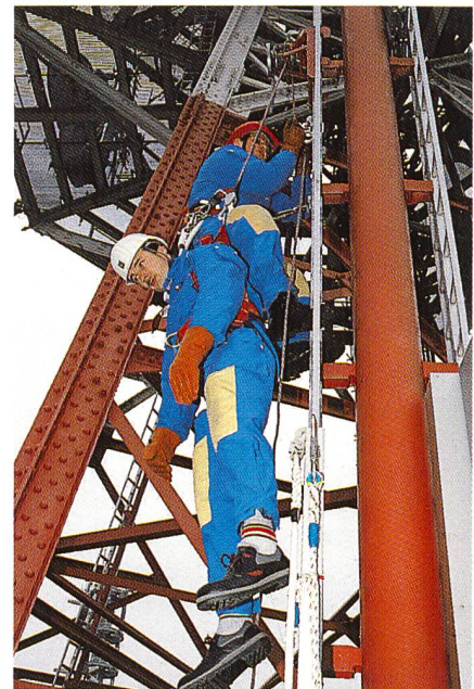
Seminar für Arbeitssicherheit in Emmelshausen bei Koblenz (D): Ein «Verletzter» wird korrekt vom Turm geborgen.

Seit dem 15. August 1996 läuft eine neue Basiswerbung der Telecom PTT mit einer Reihe von gedruckten und gefilmten Einzelsujets. Eines davon zeigt einen Telecom-Mitarbeiter, der bei eisigem Wind und Schneetreiben auf dem Jungfrauoch-Turm arbeitet. Wer das Bild an der Plakatwand oder am Bildschirm sieht, wird sich der Gefahr dieser Arbeit bewusst. In Anbetracht des Gefahrenpotentials lässt die Direktion Radiocom Männer, die auf den Türmen arbeiten, intensiv unterrichten, und zwar im Rahmen des ASIR. Telecom PTT geht davon aus, dass es Aufgabe des Managements ist, die Mitarbeiterinnen und Mitarbeiter so zu führen, dass sie unfallfrei arbeiten. Das viertägige Grundseminar der Deutschen Telekom hat zum Ziel, die Teilnehmer mit allen Arbeitssicherheitsbestimmungen und Methoden zur Rettung Verunglückter vertraut zu machen. Sie sollen zum Gebrauch der Sicherheitseinrichtungen motiviert werden und