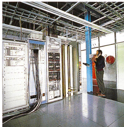
Bild 3. Im Schaltzentrum der Anlage ist modernste High-Tech präsent.

Die Anlage bietet eine ganze Reihe von wichtigen Übertragungsdiensten, so beispielsweise Verbindungen des sogenannten MediaLink-Dienstes für Fernseh- und Radioanstalten. Hier stehen vor allem Live-Übertragungen von Sportanlässen im Vordergrund, die national und international von