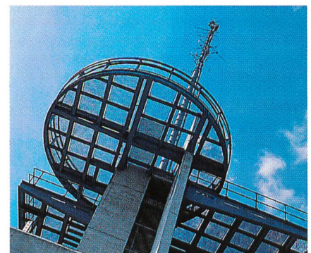
Bild 5. Blick auf eine Antennenplattform.

Odyssea ist ausbaubar, so dass die Telekommunikationsbedürfnisse flexibel gestaltet werden können, beispielsweise für die mobile Kommunikation, für Satelliten- und Richtfunkverbindungen, Radio- und Fernsehübertragungen, ob analog oder digital.