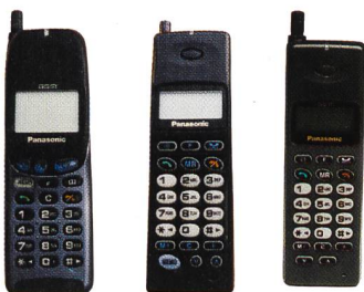
Panasonic G350, G400, G500