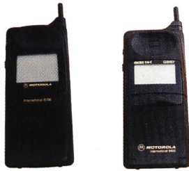
Motorola Flare, 8200, 8400, 8700

Das MC218 ist einsetzbar mit folgenden GSM Mobiltelefonen