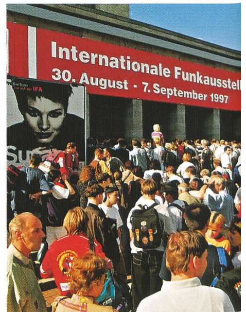
Morgendlicher Andrang zur IFA '97.

DAB war das beherrschende Thema an der IFA '97 in Berlin.