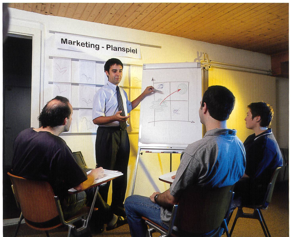
Fig. 1. Entreprises de télécommunications dans un champ de tension

L'expérience montre qu'au moment d'une transformation radicale, souvent, les valeurs négatives des systèmes ouverts se manifestent d'abord. Perte de confiance, conflits, désorientation et chaos ne sont alors pas rares. D'où le grand défi, qui consiste à atteindre un équilibre entre les valeurs po-