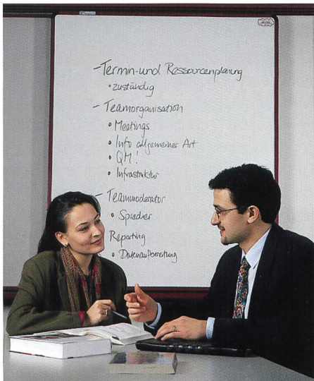
Fig. 2. Développement de produits et de réseaux

sitives des deux systèmes. Cela implique notamment d'intégrer l'histoire de l'entreprise, afin d'éviter que les aspects positifs du passé ne soient jetés par dessus bord. Les entreprises qui réussissent se construisent une culture forte à partir des valeurs positives des deux systèmes. Les dirigeants assument un rôle porteur dans cette phase de changement et de transformation. Ils sont les «multiplicateurs» des nouveaux comportements et contribuent dans une mesure décisive à la perpétuation des valeurs au sein de l'entreprise.