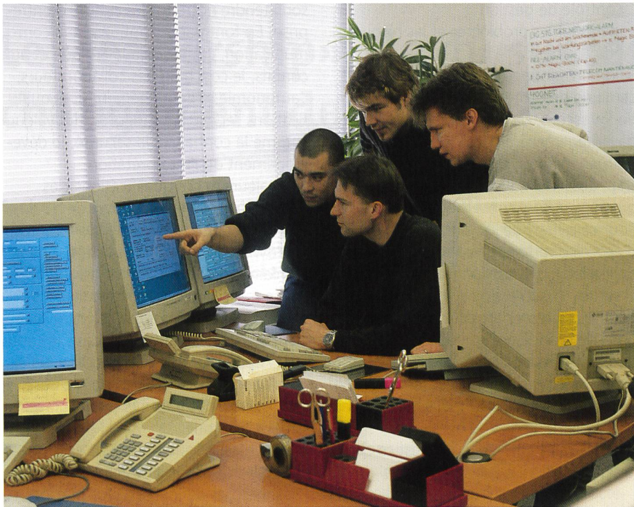
Fig. 4. Compétences spécifiques de leadership et de management

avec les outils de direction déjà introduits, Swisscom se trouve bien armée pour franchir victorieusement cette étape capitale.