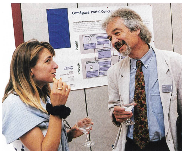
Bild 3. Auf die Gäste wartete eine professionell aufgemachte Farbdokumentation mit Hinweisen, Fotos und Programmen.