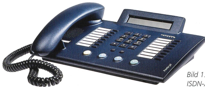
Bild 1. Pronto 32i, das ISDN-Anrufbeantworter-telefon

Dank der Normalpapier-Ausgabe können Kopien und Faxe als Dokumente abgelegt oder weiterverwendet werden. Geschäftliche und private Briefkorrespondenz kann nun per Fax auf schnelle,