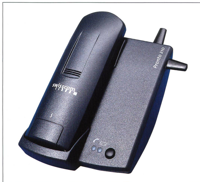
Bild 3. Pronto 210, das ausbaubare Schnurlostelefon.