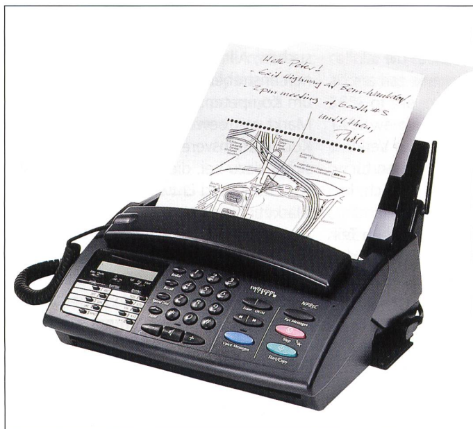
Bild 2. NP75C/NP85C, die kompakten Multiphone.

Mit dem Pronto 32i ist man dank integriertem Anrufbeantworter rund um die