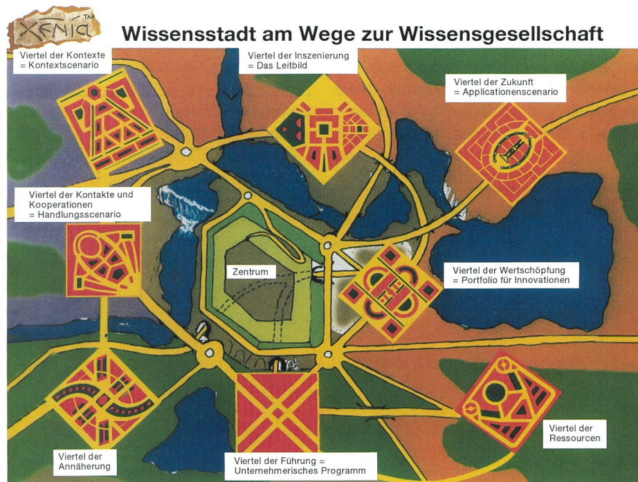
Bild 3. Ausschnitt aus dem Stadtplan von XENIA: Die verschiedenen «Stadtviertel» symbolisieren die unterschiedlichen Parameter der Problemstellung, die bei der Lösung der Gesamtaufgabe zusammengeführt werden müssen.

steilen Aufschwung, dann kommt ein proportionales Wachstum, schliesslich ein Auslaufen der Wachstumsdynamik bei gleichzeitigem Halten eines hohen Niveaus.