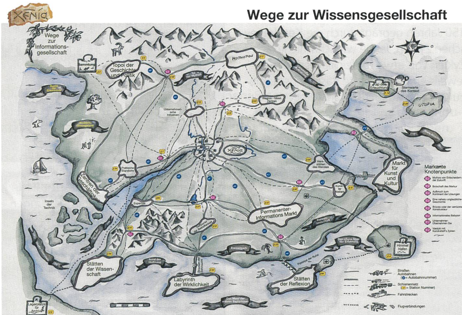
Bild 4. Wo liegt XENIA? Im Schnittpunkt sehr verschiedener Positionen, die untereinander durch Wege zur Informationsgesellschaft verbunden sind.

für das Netzwerk des fünften Zyklus werden ganz andere sein: Nicht die Multimedia-Technologie wird sich dem existierenden weltweiten Kommunikationsnetz «unterwerfen», denn sie hat sich bereits ein eigenes Netz (das Internet mit WWW) geschaffen, vielmehr wird sich letztlich die Telefonie anpassen müssen. Wir brauchen jetzt ein «Netzwerk des Wissens»; des Wissens, das sich seit 1989 entfaltet und bis 2040 unsere Gesellschaft bestimmen wird. Wenn wir mehr wissen würden, dann wüssten wir auch um die Wege, wie wir vorgehen können. Wir können heute im Internet allenfalls den Rohstoff «Wissen» finden, aber seine Vernetzung und damit simultane Nutzung in vielen Disziplinen ist entscheidend.