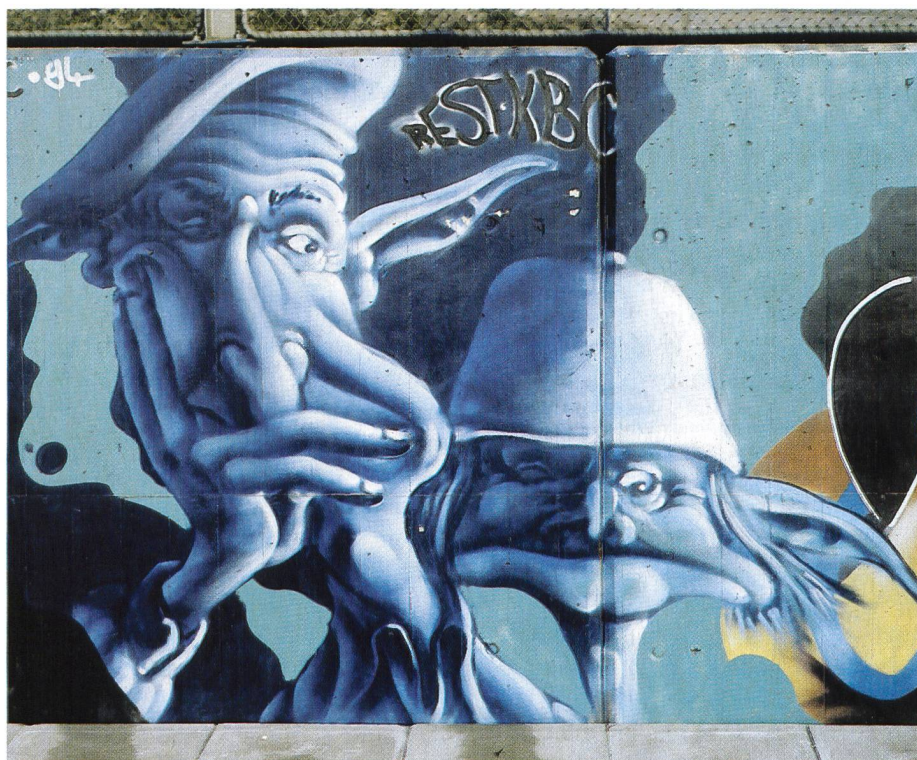
Fig. 2. Le plus gros défi que doit relever l'internet est sans doute la tarification.

Le plus gros défi que doit relever l'internet est sans doute la tarification. Le modèle du forfait utilisé aujourd'hui par les fournisseurs est inadéquat pour les services tels que la téléphonie et doit être