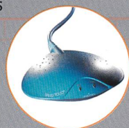
Alcatel SpeedTouch 330™ USB «plug and play»