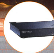
Alcatel SpeedTouch™ Pro Firewall Router mit Firewall