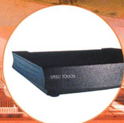
Alcatel SpeedTouch 570™ wireless Drahtlos ins Internet