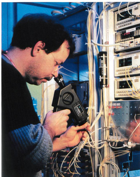
Letzte Vorbereitung zum DWDM-Systemtestlauf (Wellenmultiplex-System) in den Bell Labs von Lucent in Nürnberg.

Der neue, in den Bell Labs entwickelte WaveStar-L-Band-Verstärker erhöht die Bandbreite optischer Netze. Er ermöglicht es Netzbetreibern, Daten, Sprache und Bilder im vierten optischen Fenster, dem L-Band, zu übertragen. Dieser Wellenlängenbereich zwischen 1,565 und 1,620 nm wird zurzeit nicht genutzt. Heutige Wellenlängenmultiplex-Systeme, so genannte DWDM (Dense Wave Division Multiplexing) arbeiten im dritten optischen Fenster