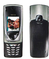
Phone → Camera

Manchmal geschehen Dinge, die man nicht in Worten beschreiben kann. Mit dem neuen Nokia 7650 können Sie sich auch mitteilen, wenn Sie sprachlos sind. Das Handy hat eine Digitalkamera integriert und weist ein grosses Farbdisplay auf, das zugleich als Sucher dient. Wenn Sie nun einen besonderen Moment mit Ihren Freunden teilen wollen: einfach knipsen und Schnappschuss versenden. Entdecken Sie die neuen inspirierenden Möglichkeiten von Multimedia Messaging (MMS). Kombinieren Sie Text, Sprache und Bild nach Belieben. Zeigen Sie, was Sie meinen.