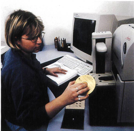
Die kommerzielle Abwicklung von Geschäften verlagert sich vermehrt in den virtuellen Wirtschaftsraum. Siemens