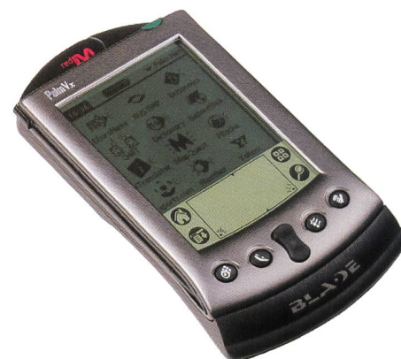
Bild 11. Red-M-Blade für Palm Vx (im Bild hinter dem Palm installiert).