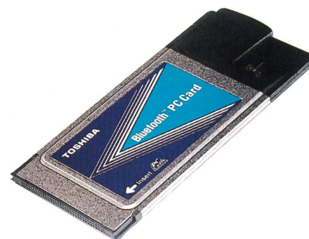
Bild 12. Bluetooth-fähige PCMCIA-Karte von Toshiba zur Erweiterung von PC und Beamer.