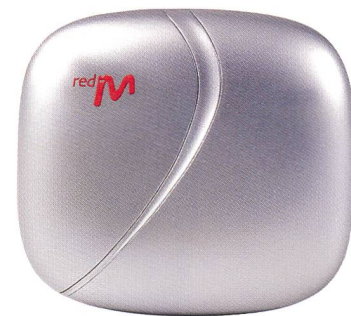
Bild 9. Red-M 1050AP LAN Access Point.

Red-M (Homepage: www.red-m.com ) ist ein führender Anbieter von lokalen Kommunikationslösungen basierend auf Bluetooth. Die Netzbasis dazu liefern die Zugangsserver (Access Server, kurz AS), die an die Zugangspunkte (Access Points, kurz AP) angeschlossen werden. Der Red-M-3000AS stellt das Bluetooth-Basisnetz bereit, an dem eine Anzahl von Endgeräten (PDAs, Laptops, PCs und Handys) angeschlossen werden können. Mit einem oder mehreren Red-M-1000-APs kann das Einzugsgebiet des 3000AS erweitert und damit die Anzahl der an das Bluetooth-Netz angeschlossenen Benutzer erhöht werden, die dadurch eine höhere Mobilität erhalten (siehe dazu auch den Kasten «Bluetooth-Kongress 2002»). Als Stand-alone-Lösung spielt der Red-M-1050AP die Rolle des Einstiegsmodells in das «Bluetooth Networking» für Local Area Networks (LANs) mit einem Versorgungsradius von bis zu 100 m (im Freien). Schliesslich gibt der Red-M-«Blade» den Nutzern eines Palm Vx und eines Handspring Visor die Möglichkeit, sich via Bluetooth mit dem Büro-PC zu verbinden, um persönliche Daten (Termine, E-Mails, neue Dokumentenversionen) mit dem Intranet zu synchronisieren. Distributor von Red-M-Produkten in