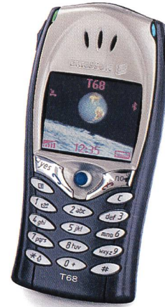
Bild 2. Ericsson-Triple-Band-GSM-Handy T68i mit Bluetooth, GPRS, Wireless Java und MMS.

spektiven von Bluetooth vor Augen zu führen (siehe Kasten).