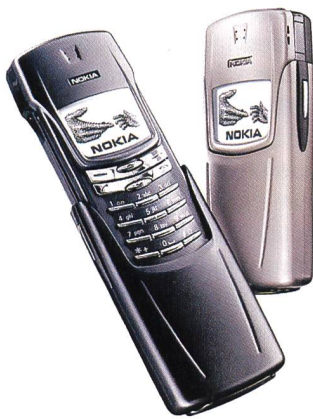
Bild 5. Nokia 8910.