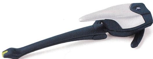
Bild 3. Ericsson-Bluetooth-Headset HBH-15.