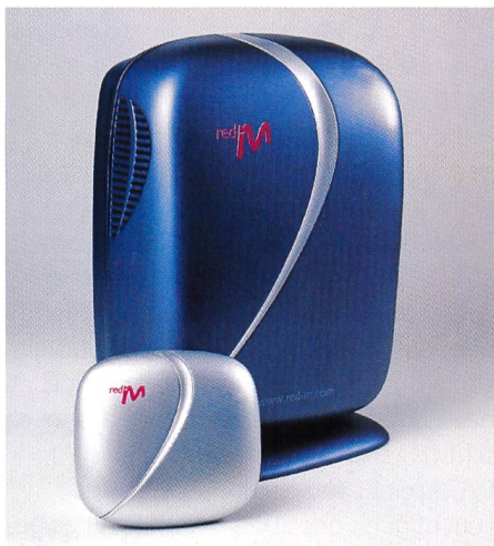
Bild 8. Red-M 3000AS Access Server und 1000AP Access Point.

sungen 103 × 46 × 20 mm deutlich kleiner als das 6310i. Die Hauptanwendung für Bluetooth sieht Nokia wie Mitbewerber Ericsson ebenfalls in der drahtlosen Synchronisierung der persönlichen Agenda mit dem PC im Büro und im drahtlosen Freisprechen beispielsweise im Auto. Darum bietet Nokia als Ergänzung zu seinen Handys das passende Zubehör mit Bluetooth-Technik an, so zum Beispiel eine Freisprecheinrichtung (Bild 6), eine Netzwerkkarte als Einschub in den PC (Bild 7) und einen Bluetooth-Erweiterungskit für das Auto. Unter der Bezeichnung PC Suite 4.52 bietet Nokia für das 8910 zudem ein Softwarepaket an, welche das Management des Handys ab PC erlaubt. Damit lassen sich die Telefoneinstellungen, der Organizer mit allen Terminen und Kontakten oder To-Do-Listen vom PC aus verwalten. Es lassen sich aber auch eigene Logos und Klingeltöne erstellen und auf das 8910 ab dem eigenen PC herunterladen. Die PC Suite 4.52 wird übrigens bei allen 8910 gratis mitgeliefert, sie lässt sich aber auch inklusive neuer Updates von der Homepage: www.nokia.com herunterladen.