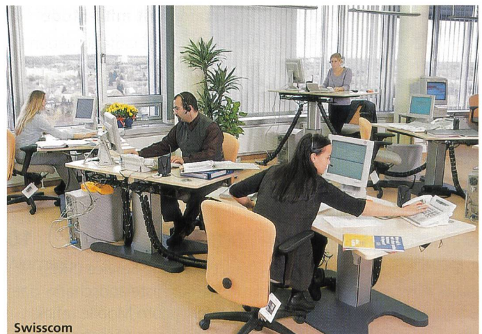
Bild 1. Blick in ein modernes Call Center.

tendste telefonische Kontaktpunkt eines Unternehmens mit seinen Kunden. Die Call Centers haben für die anrufenden Kunden nur eine Zugangsnummer. Oft sind dies heute Gratisnummern (0800), aber auch kostenpflichtige Nummern (0844, 0848, 0900) sind möglich. Grundsätzlich wird bei Call Centers zwischen Inbound und Outbound unterschieden: Bei Inbound ruft der Kunde das Unternehmen an, bei Outbound wird der Kunde vom Unternehmen an-