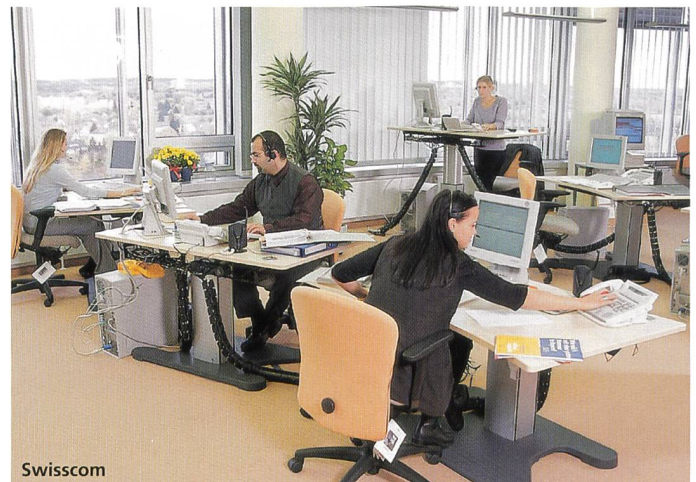
Bild 1. Blick in ein modernes Call Center.

tendste telefonische Kontaktpunkt eines Unternehmens mit seinen Kunden. Die Call Centers haben für die anrufenden Kunden nur eine Zugangsnummer. Oft sind dies heute Gratisnummern (0800), aber auch kostenpflichtige Nummern (0844, 0848, 0900) sind möglich. Grundsätzlich wird bei Call Centers zwischen Inbound und Outbound unterschieden: Bei Inbound ruft der Kunde das Unternehmen an, bei Outbound wird der Kunde vom Unternehmen an-