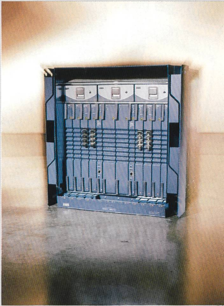
Multiservice Switching Platform ONS 15600

Mit der Multiservice-Switching-Plattform ONS 15600 erweitert Cisco sein Portfolio für optische Netzwerklösungen, COMET (Complete Optical Multiservice Edge and Transport). ONS 15600 ist für den Einsatz an Points-of-Presence (PoP) von Carriern und in grossen Unternehmenszentralen konzipiert und bietet zahlreiche Netzwerkfunktionalitäten in einer einzigen Komponente. Sie vereint Elemente verschiedener Metro-Systeme wie SONET/SDH-Multiplexer (Synchronous Optical Network/Synchronous Digital Hierarchy) und digitale Cross-Connect-Netzwerkbestandteile. Die Plattform wurde für TDM-basierende Dienste (Time Division Multiplexing) optimiert und kann gleichzeitig für die paketorientierte Datenübertragung eingesetzt werden. ONS 15600 nimmt aufgrund der hohen Port-Dichte weniger Stellfläche als herkömmliche Breitband-Cross-Connects ein. Mit dem Einsatz der Multiservice-Plattform profitieren Service Provider von neuen Umsatzpotenzialen sowie niedrigen Anschaffungs- und Lebenszykluskosten. Cisco hat zudem die Funktionalitäten der optischen Komponenten ONS 15454 und ONS 15327 sowie des Cisco Transport Manager (CTM) erweitert. Die optische Transportplattform ONS 15454 unterstützt Datenanwendungen, die Protection Channel Access zur Anpassung an steigenden Datenverkehr nutzen. Die ONS 15327 wurde um Gigabit-Ethernet-Fähigkeit und Ethernet-basierende Band-