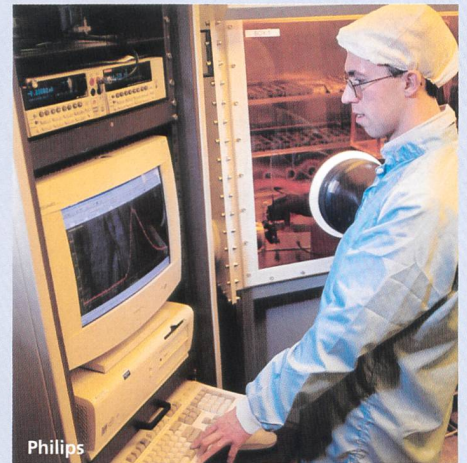
Das Bild zeigt einen Forscher beim Testen der optischen Eigenschaften des zwei-farbigen EL-Bausteins.

Das Philips-Forschungslabor Natlab und die Universität Amsterdam haben gemeinsam ein neues organisches Material entwickelt, das je nach angelegter Spannung entweder rotes oder grünes Elektrolumineszenzlicht abgibt. Es besteht aus einem halbleitenden Polymer und einem Metallkomplex, die beide unterschiedliche Energien benötigen, um in den erregten Zustand zu kommen. Beim Aufbau dieser neuartigen Leuchtdiode wird das Basismaterial zwischen zwei unterschiedliche Elektroden eingebracht: Die eine besteht aus Gold, die andere aus Indium-Zinn-Oxid (ITO). Wird an die ITO-Elektrode eine positive Spannung angelegt, dann wird nur der Metallkomplex im Basismaterial aktiviert: Das Material leuchtet dann rot. Wird hingegen die ITO-Elektrode negativ vorgespannt, dann wird das Polymer im Basismaterial erregt – die Strahlung liegt nun im grünen Bereich, entsprechend dem Bandabstand des Polymers. Beide Farben haben eine gute Sättigung und sind nicht mit anderen Farben vermischt. Die Forscher träumen schon von einer Verkehrsampel, die