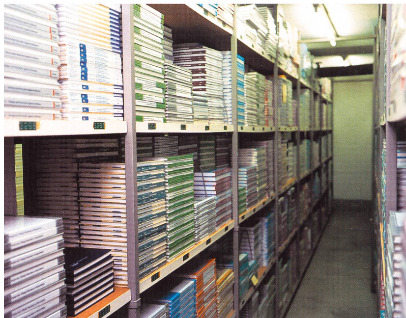
Der S. Karger Verlag ist auf die Publikation von medizinwissenschaftlichen Periodikas und Büchern spezialisiert.

Das Internet setzt sich als Informationsquelle und Marketing-Instrument zunehmend durch. Mit den IP-Plus® Internet Services bietet Swisscom Enterprise Solutions ihren Kunden die Voraussetzung für die professionelle Nutzung des Internets. Dabei sorgt der IP-Plus®-Virus-&-Spam-Filter dafür, dass Spam nicht zum E-Mail-Killer wird. Der S. Karger Verlag aus Basel setzt erfolgreich auf diese Lösung.