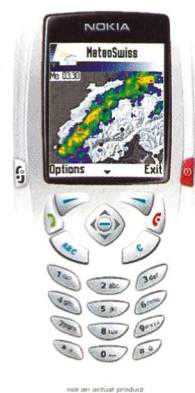
Bild 2. Die aktuellen Niederschlags-Radarbilder mit SwissRadar.

Für einfache Anfrage-Antwort-Dienste ist diese Form gut geeignet. Die Bedienung mit Schlüsselwörtern und Zielnummern ist allerdings umständlich. Zudem muss jede Interaktion mit dem Dienst mit einer neuen Kurzmitteilung initiiert werden.