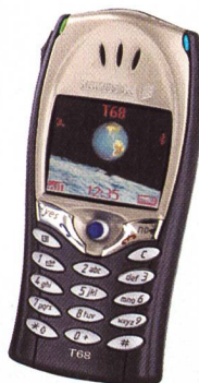
Sony Ericsson T68