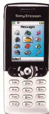
Sony Ericsson T610