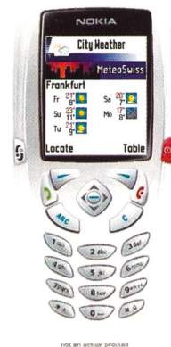
Bild 3. Die Wetterprognose für die nächsten fünf Tage von rund 200 Städten weltweit mit CityWeather.