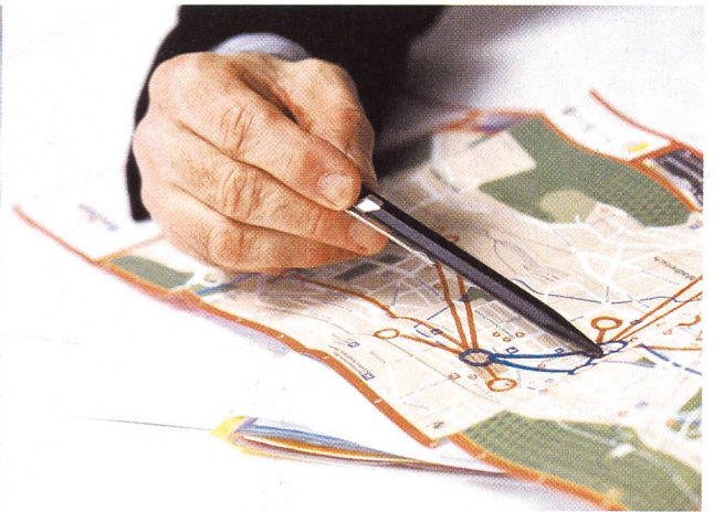
Die Stadtverwaltung Biel ist für innovative Technologien bereit.

Die Schwierigkeiten, die dem Informatik- und Logistikverantwortlichen der Stadtverwaltung Biel begegnen, sind vielfältig. Da ist einmal die Schwierigkeit, dass die Verwaltung einer Stadt dieser Grösse ein inhomogenes Ganzes darstellt und ein zentraler Dienst einer ganzen Reihe von Bedürfnissen und Sonderwünschen entgegenkommen muss. Dann die Tatsache, dass die Stadt mit ihren etwas mehr als 50 000