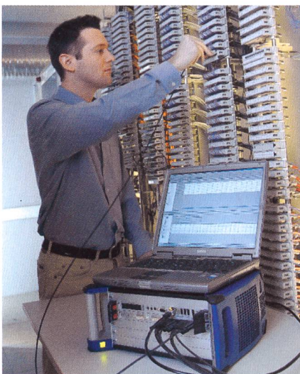
Monitoring-, Optimierungs- und Analysetools.

Info: Exanovis AG, Moosstrasse 8A, CH-3322 Schönbühl, Tel. 031 850 25 25, Fax 031 850 25 20, info@exanovis.com , www.exanovis.com