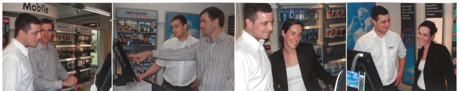
Swisscom Shops: Swisscom liegt im Ranking der Kundenbewertung in Führung.

Von besonderer Wichtigkeit sind für Kunden Fragen zu unterschiedlichen Garantien. Um den Wünschen zu entsprechen, hat Swisscom Mobile 2005 mehrere neue Garantien eingeführt. Zum Beispiel haben seit kurzem alle Geräte eine 2-Jahres-Garantie, ausserdem kann bei Schäden künftig ein Ersatzgerät gewährleistet werden. Darüber hin-