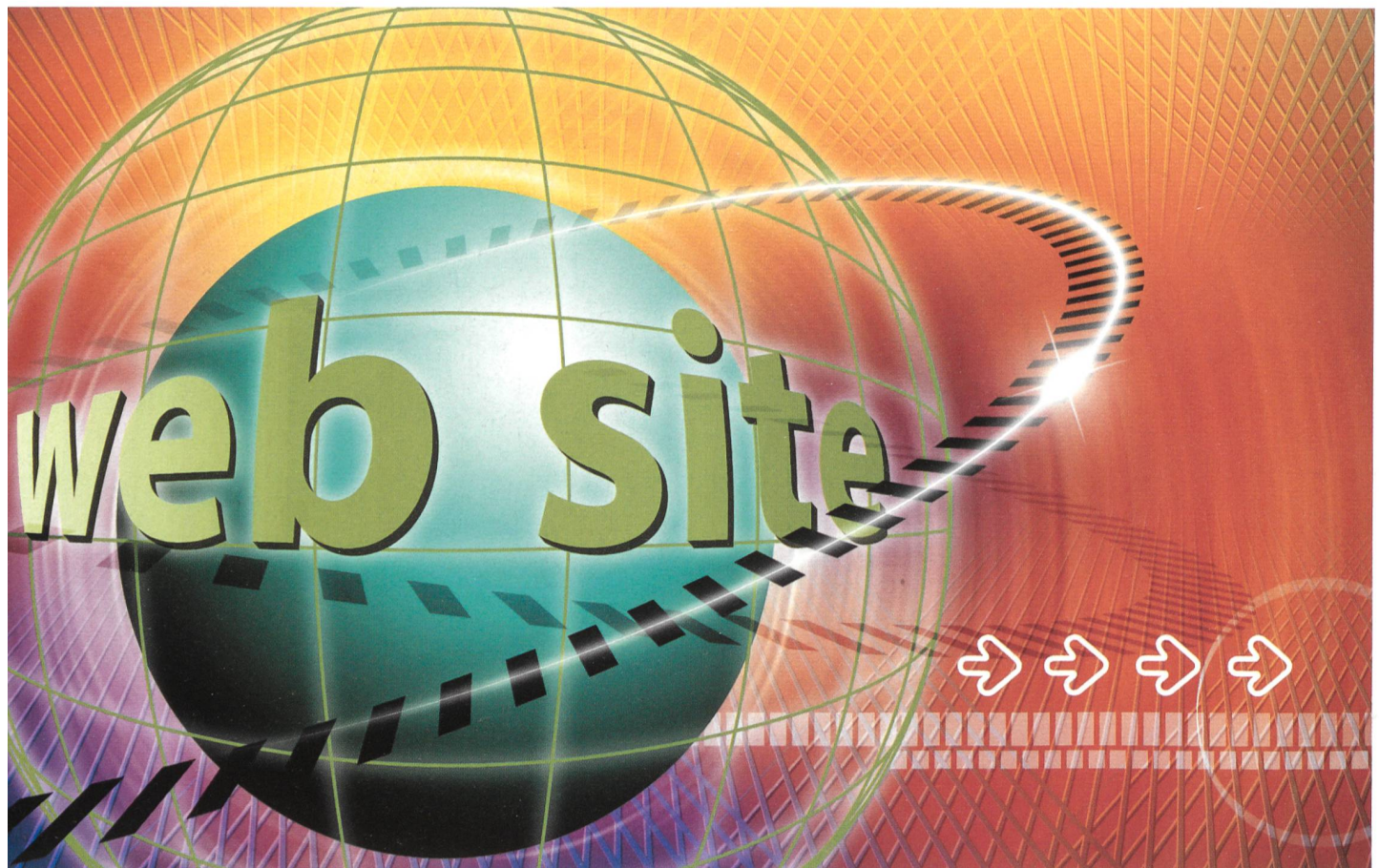
Bild 1. Das Internet hat die Kommunikation revolutioniert.