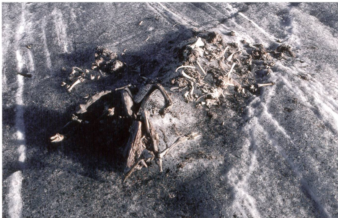
Abb. 2. Die Fundsituation mit der Mumie (vorne) und den auf zwei Flächen verteilten Knochen des Kitzes. Zu beachten ist die Wirkung des durch die Knochen erzeugten Schattens auf die Schmelzgeschwindigkeit des Eises. Blick Richtung NE. Aufnahme vom 27. August 1994.

Extremitäten sind behaarte Hautpartien erhalten. Die weitere Begutachtung des Fundes und der unmittelbaren Umgebung erbringt dann noch einen Zusatzfund, der allerdings auch schon bei der Entdeckung bemerkt wurde: Verstreut lagen Kiefer, Rippen, Wirbel, Laufknochen, Teile des Schädels mit den beiden oberen Backenzahnreihen und ein Mehl aus Haaren und Hautstücken eines viel kleineren Tieres unmittelbar neben der Mumie auf dem Eis (Abb. 2). Die Überreste einer Geiss und eines Kitzes lagen also ausgeapert auf der Gletscherfläche vor dem Gletscherhorn; die Mutter vollständig mumifiziert und demzufolge hervorragend erhalten, das Kitz nur noch mit Knochen dokumen-