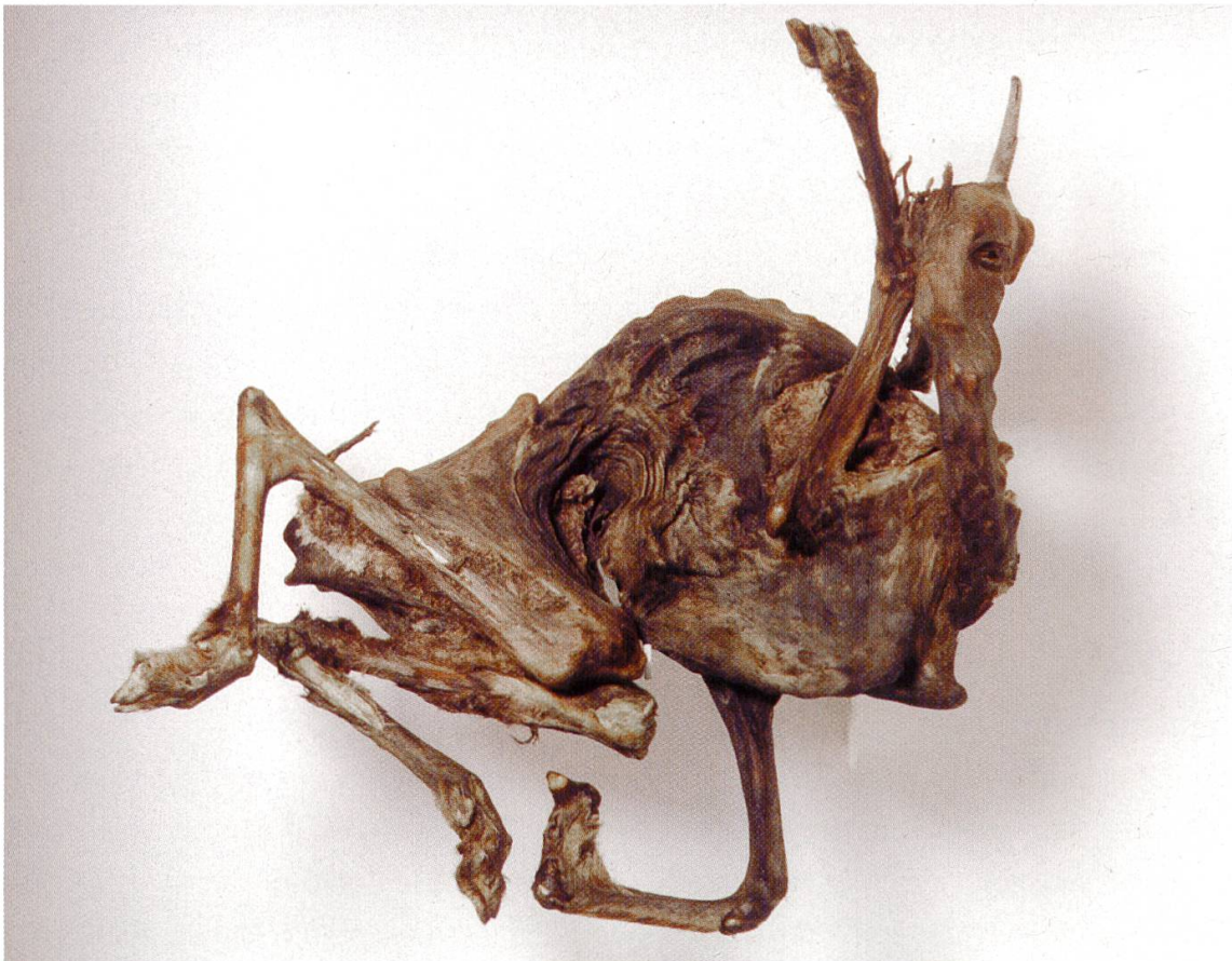
Abb. 1. Die Gletschermumie «Strubeli», wie sie seit 1998 im Naturhistorischen Museum dem Besucher in der erdwissenschaftlichen Ausstellung «Steine der Erde» präsentiert wird.

Die Gemsmumie ist im Naturhistorischen Museum unter der EDV Nr. 104 3851 registriert und wird seit 1998 in der Ausstellung «Steine der Erde» gezeigt (Abb. 1).