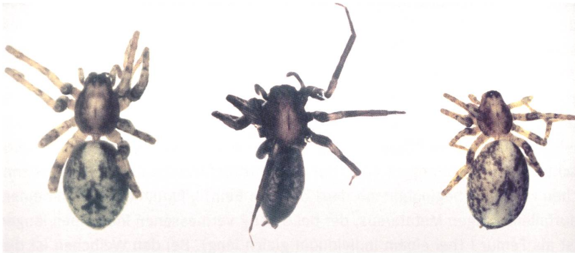
Abb. 2. Variabilität von Körperfarbe und Körpergrosse bei Anyphaena furva . Linkes Tier aus Tschechien (coll. Růžicka), mittleres und rechtes Tier aus Bayern (coll. Bauchhenss). Erläuterung im Text.

Die Variationsbreite der Prosomalänge ist aus Tab. 1 zu ersehen. Um die Variabilität der Prosomaproportionen aufzuzeigen, sind die Verhältniszahlen einerseits für Länge zu maximaler Breite (RLBr) und andererseits für Maximalbreite zu Breite auf Höhe der Hinteraugenreihe (RBr) angegeben. Diese Daten sind weder mit der Grösse noch mit der Färbung des Prosomas korreliert.