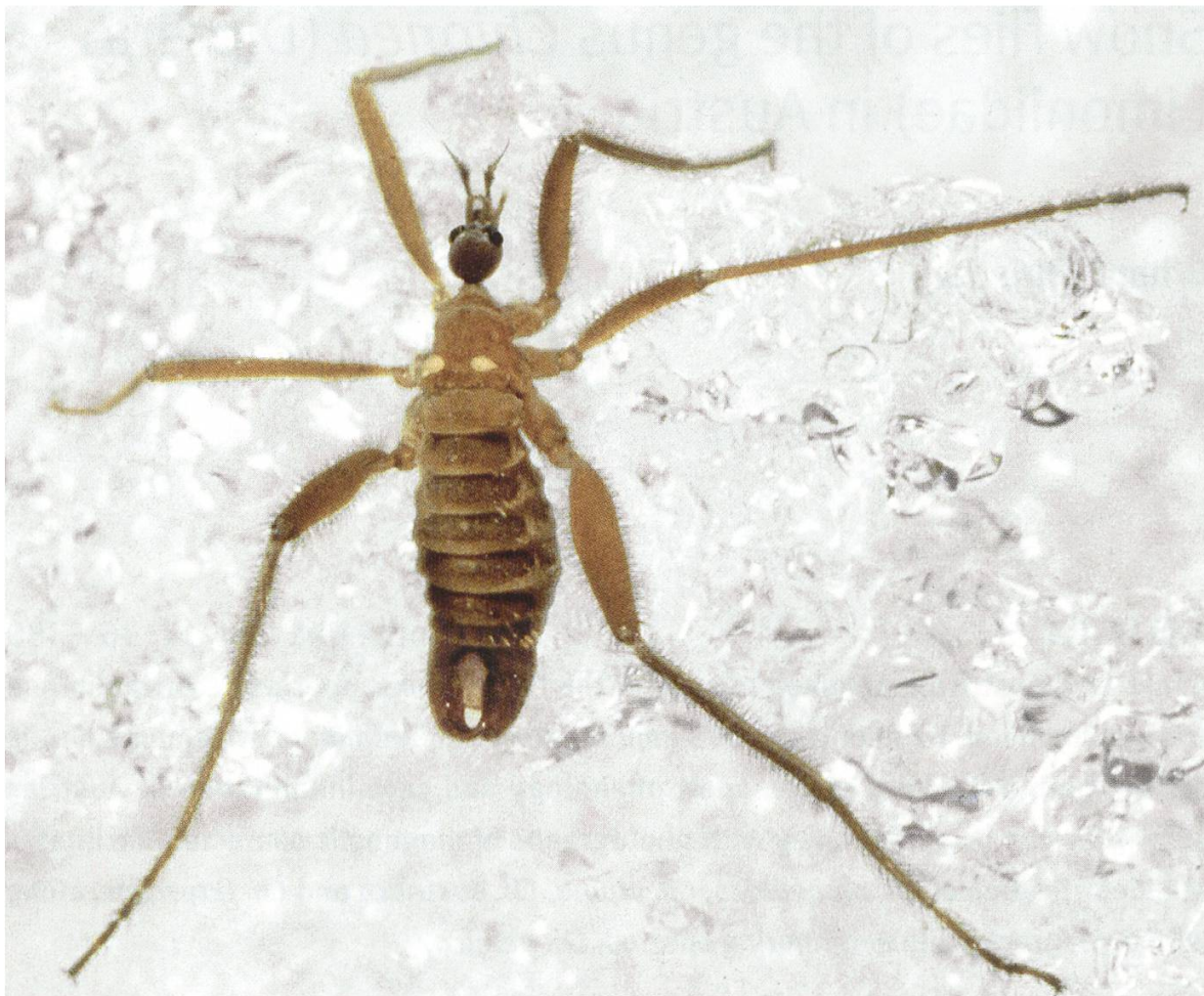
Fig. 1. Habitus of a snow fly. Well visible are the halteres, but not the vestigial wings. Chionea austriaca , male on snow cover. Lunz, Lower Austria; 29 Jan., 1995.

I dedicate this article to the memory of the eminent Austrian biodiversity researcher, Konrad Thaler.