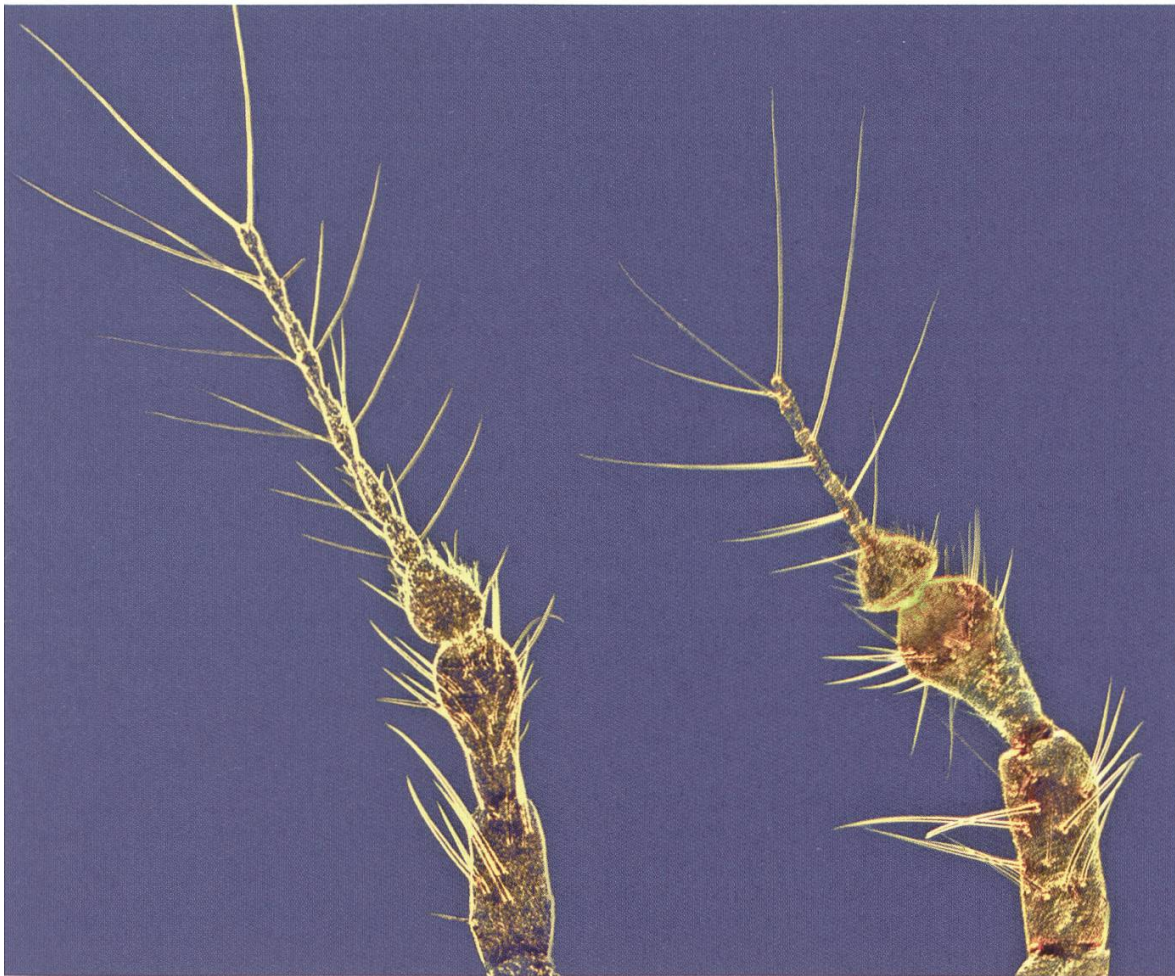
Fig. 2. Antenna of Chionea araneoides (left) and Chionea austriaca (right).

ment of North American species, Byers 1983. Nomenclature conforms to the online databases "Fauna Europaea" and "Catalogue of the crane flies of the world" (Oosterbroek 2004, 2006), and to the recently published review of the European Chionea crane flies (Oosterbroek & Reusch 2008) which contains an illustrated key to all recognized species of Europe.