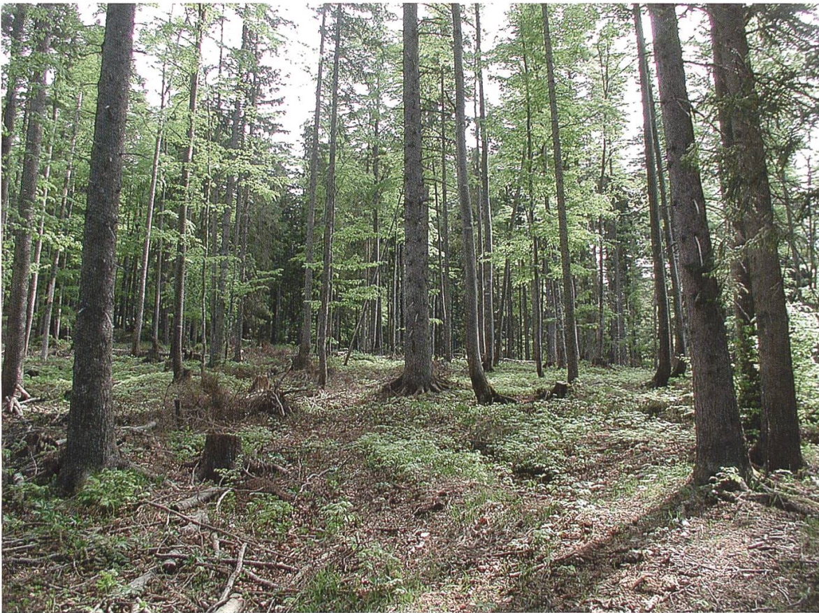
Abb. 3. Fichten-Tannen-Buchen-Wirtschaftswald-Untersuchungsfläche "Ameisshöhe".