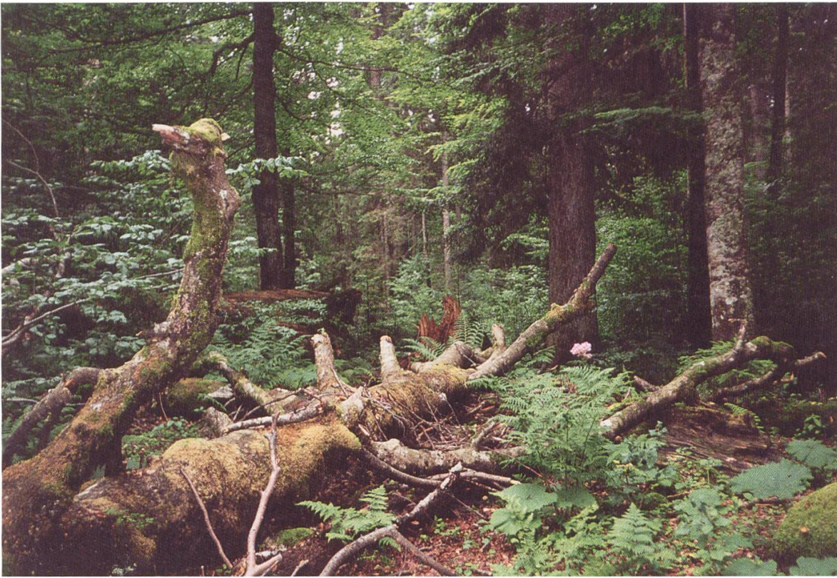
Abb. 2. Fichten-Tannen-Buchenwald-Untersuchungsfläche "Grosser Urwald".