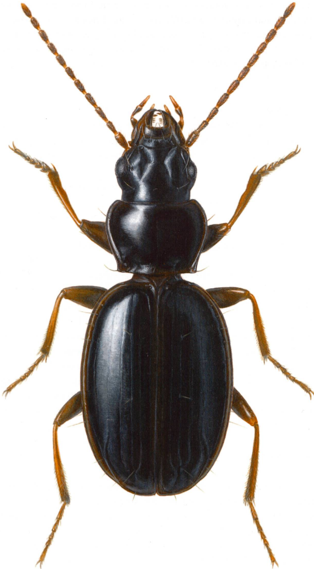
Abb. 1: Trechus schyberosiae sp. nov., Holotypus, Habitus dorsal. Aquarellzeichnung von Peter Schüle.