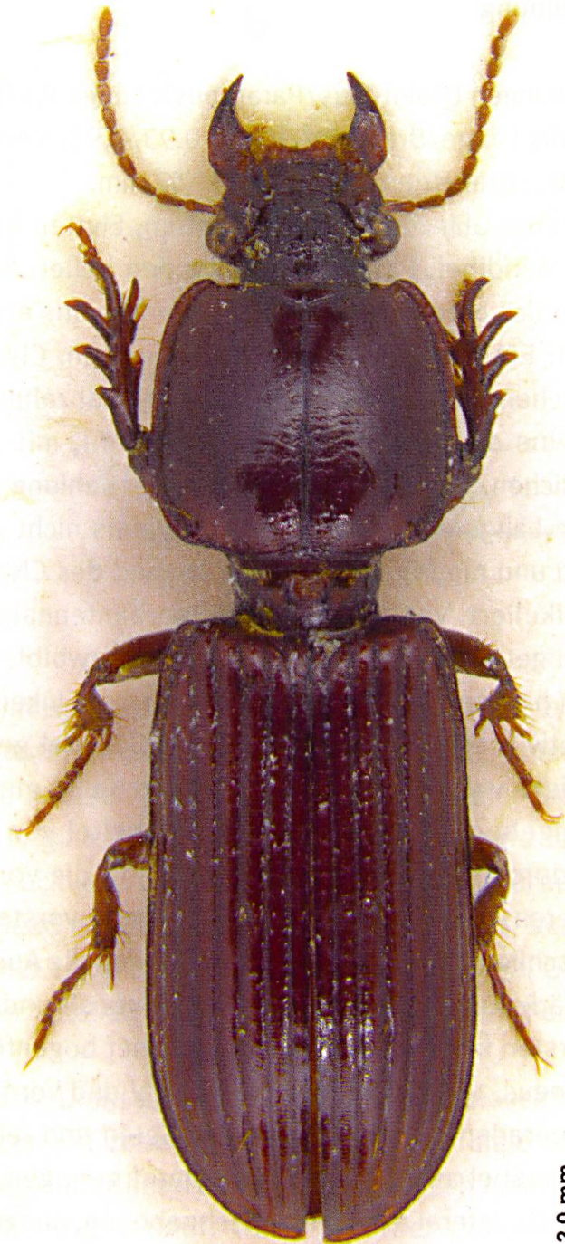
Abb. 1: Rugilucivina promineoculata sp. nov., Paratypus, Habitus. Länge 9,1 mm.