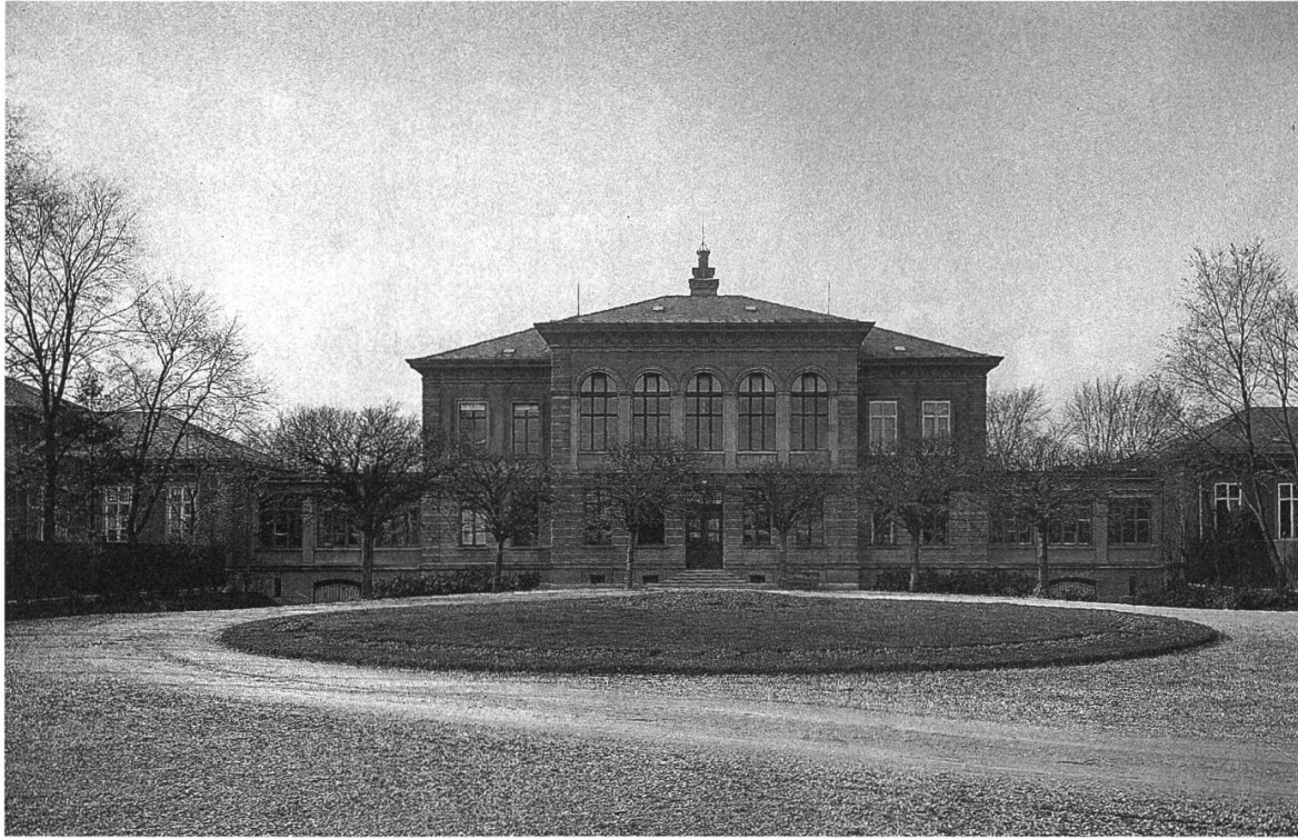
Abb. 28: Verwaltungsgebäude der Irrenanstalt Friedmatt in Basel (ab 1899 Kantonale Heil- und Pflegeanstalt Friedmatt). Aufnahme ca. 1925.