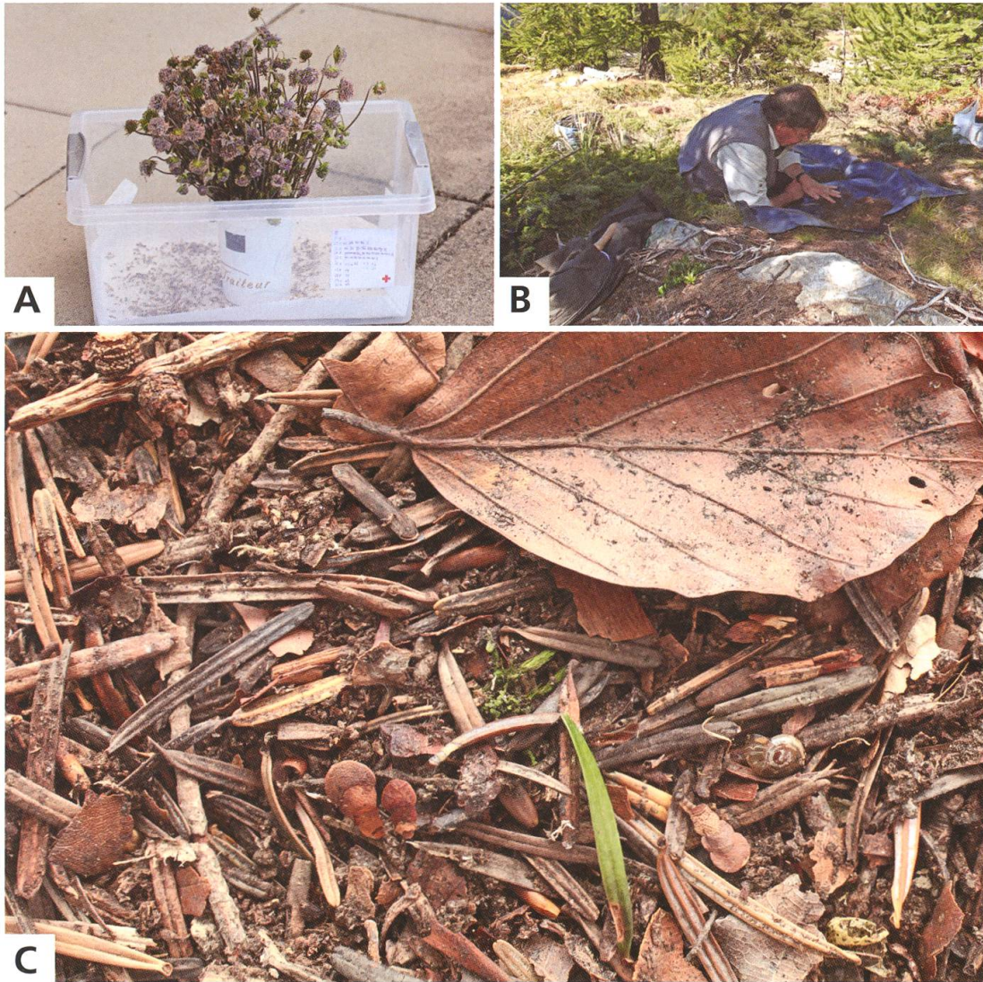
Abb. 3. Techniken zum Auffinden der Jugendstadien.

A Strauss von Succisa pratensis -Blüten zum Nachweisen der Jungrauen von Nemophora minimella 18 und Nemophora cupriacella 12 , St-Imier BE, 21.8.2013.