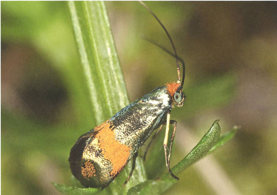
Abb. 2. Nemophora dumerilella 19 , ♀, Sent GR, 12.8.2014, e.o.