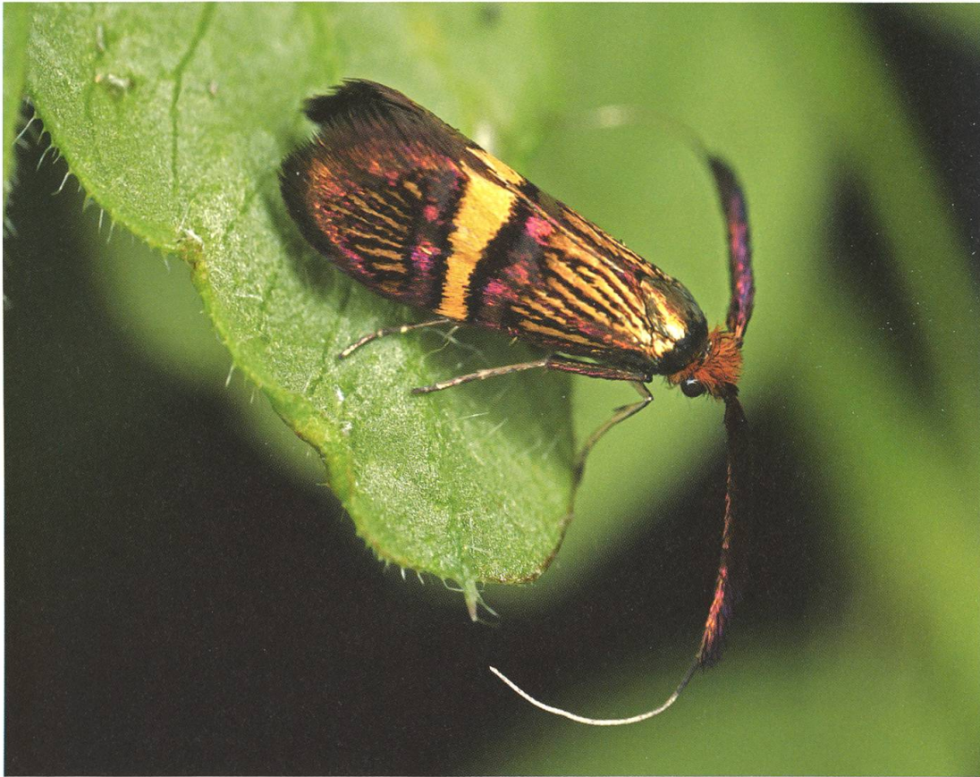
Abb. 40. Adela croesella 32 , ♀. La Neuveville BE, 26.10.2011, e.l.